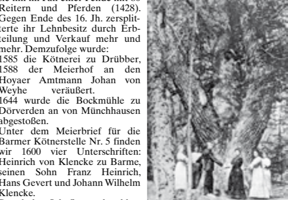
Die 1000-jährige Mathildeneiche im Drübber Holz, Postkartenausschnitt aus 1910, Beschreibung: Mathildeneiche, 6,10 m Umfang

mit einem Baumumfang von 5,32 m und einem Durchmesser von 2,06 m.“