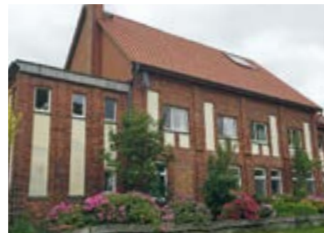
Das Verwaltungsgebäude der Anlage Glücksborn wird heute als Wohnhaus genutzt.

hatte das Deutsche Reich seine Monopolstellung auf diesem Gebiet verloren. Der Abbau in Ahnebergen war damit unrentabel geworden. Die von Kalisyndikat erteilte vorläufige Beteiligungsziffer musste anderweitig verkauft werden. Der Betrieb ruhte in den Jahren 1916 bis 1918 vollständig. Die AG Deutsche Kaliwerke nahm 1920 die Arbeiten kurzfristig wieder auf, es waren allerdings nur Instandsetzungsarbeiten. Im Jahr 1922 kam es zur vorläufigen Stilllegung beider Werke. Im Jahr 1924 wurden die Schächte geschlossen und mit Oberflächenwasser geflutet. Es folgte das Abdecken der Schächte und der Abbau der Anlagen wie der Abbruch einiger Gebäude. Die zeitgleiche vollständige Verfüllung beider Schächte begann 1999 mit insgesamt 22.000 Tonnen Kies und Schotter. Dann wurden beide Schächte mit Betondeckel fest verschlossen.