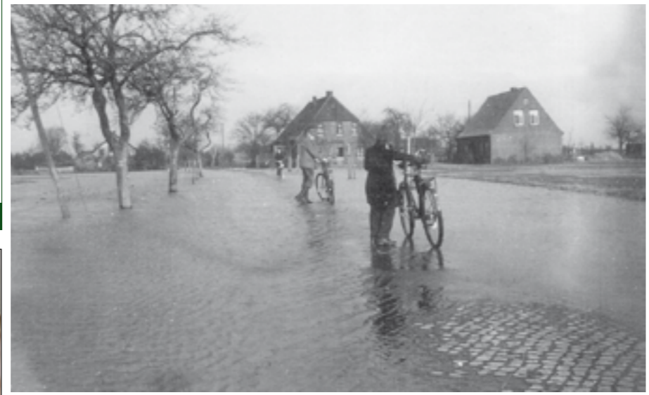
Die Aufnahme zeigt die Kreisstraße von Hoya nach Mehringen kurz vor Hellberg. Rechts im Bild ist das Haus von Herbert Pfeiffer und mittig von Schulte/Hildebrand zu sehen.