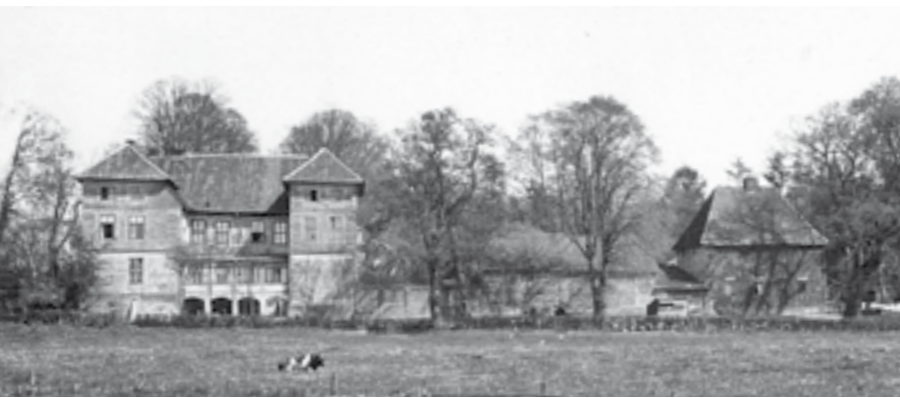
Gutshof Drübber (Hauptgebäude), 1929, von der Weser aus gesehen.

Eine Aktion der AG Geschichte/Archäologie im Ehmken Hoff e.V.