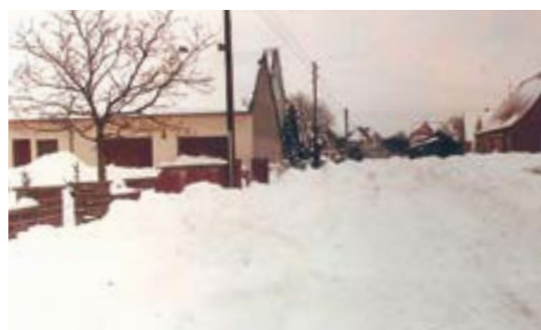
Sandberg im Schnee 1979

Ab ca. 1980 war dann aber eher kein Verlass mehr auf den alljährlichen winterlichen Schnee und das Rodelvergnügen. Aber der Winter 1978/1979 hatte es noch einmal so richtig in sich. Es waren förmlich Schneemassen, die damals vom Himmel fielen und nicht nur den Sandberg, sondern das Leben in ganz Deutschland beherrschten. Zu dieser Zeit ist auch das obige Foto entstanden. Es zeigt die Straße Sandberg aus Richtung Mühlenweg in Richtung Lange Straße. Zum Vergleich dazu das untere Foto, das den Sandberg aus gleicher Perspektive im Januar 2022 zeigt. Auf diesem Foto fehlt nicht nur der Schnee, sondern es fehlen z.B. auch die „Telegrafmasten“, die vor 40 Jahren bei uns noch Standard waren. Und auch der markante Walnusbaum auf der linken Seite ist durch Rotdornbäume ersetzt worden. Neu gepflanzt worden sind die Zierapfelbäume an der rechten Straßenseite, von denen aber heute auch nicht mehr alle stehen.