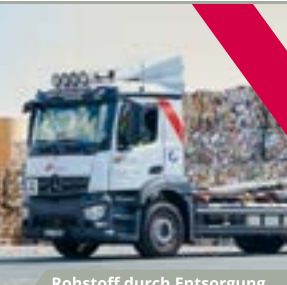
Rohstoff durch Entsorgung.

Altpapier Akten Bauschutt Kunststoffe Folien Reststoffe