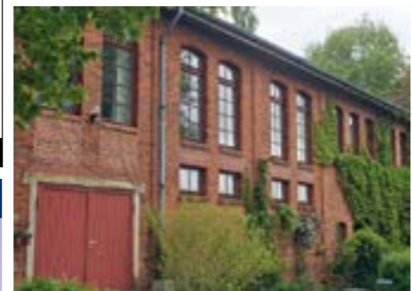
Das ehemalige Verwaltungsgebäude von Alicenhall wird heute privat genutzt.

Dezember 1911 gegründet. Sie ging eine Interessengemeinschaft mit der Gewerkschaft Alicenhall in Ahnebergen ein. Diese bot sich an, als die Gewerkschaft Alicenhall enge Verbindungen zu den Gewerkschaften Wilhelmine und Carlsglück in Hülsen aufgenommen hatte. Unter Ausnutzung dieser guten Möglichkeiten sollte die Verwertung der in Ahnebergen geförderten Salze in der Fabrik von Wilhelmine und Carlsglück kostengünstig durchgeführt werden. Von den Anlagen am Schacht Glücksborn ist auch nur noch das Verwaltungsgebäude erhalten. Es wurde auch zu einem Wohngebäude umgebaut. An dem neu angelegten Verbindungsweg vom Heumarschweg zur Kreisstraße, dem Schachtweg, entstanden zwei Wohnhäuser und ein Pumpenhaus, das heute nicht mehr vorhanden ist. Für den Transport der Kali- und Steinsalze wurde eine Bahn zum Bahnhof Wahnebergen gebaut. Die Trasse überquerte die Kreisstraße 14 in der Mitte zwischen der damaligen Schranke und dem Ortsausgang von Ahnebergen. Sie war noch bis zur Erneuerung der Kreisstraße gut zu erkennen. Der Ausbruch des 1. Weltkrieges machte allerdings allen Träumen bald ein Ende. Nach der Niederlage, musste Deutschland seine Kalilagerstätten im Elsass an Frankreich abtreten und damit