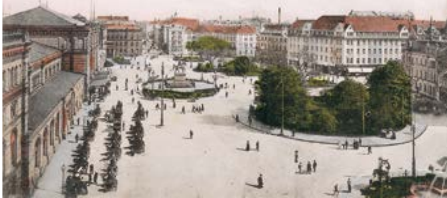
Vor vielen Jahren als Motiv einer historischen Postkarte.