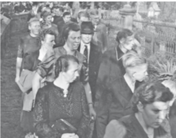
... Nr. 91 in Magelsen vor vielen Jahren.