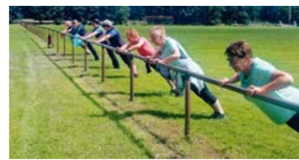
Outdoorfitness stärkt Herz und Immunsystem

Kursangebote Auf unserer Website www.tsveystrup.de kannst du unser abwechslungsreiches Kursprogramm einsehen. Zu jeder Jahreszeit haben wir hier ganz unterschiedliche Angebote, die sich an alle Interessierte richten. Hierbei haben unsere Mitglieder einen kleinen Preisvorteil, aber auch Nicht-Mitglieder sind herzlich eingeladen, die Angebote in Anspruch zu nehmen. Hier ein kleiner Auszug auf dem aktuellen Kursangebot: