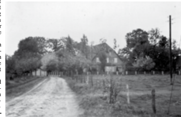
Die Aufnahme entstand kurz nach dem Krieg. Rechts im Bild ist der Hof Kramer/Meyer. Die Warper Dorfstraße wurde von den Panzern kaputt gefahren.