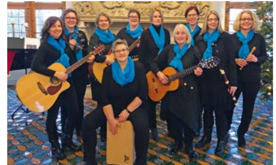
Die Gruppe Saitenklang aus Blender freut sich über Mitstreiterinnen. Die Aufnahme entstand 2019 im Schloss Erbhof, Thedinghausen.