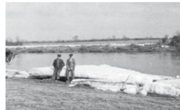
Eisschollen auf der Weser, April 1942