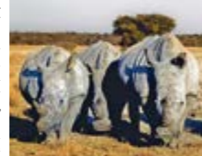
Namibia und Botswana sind die spannendsten Safariländer Afrikas!

EYSTRUP. Am Sonntag, den 27. Februar 2022 veranstaltet der Heimatverein Eystrup einen Vortrag über Afrika, Namibia, Botswana und Simbabwe im Alten Güterschuppen in Eystrup. Am Bahnhof 2. Das klingt nach Abenteuer, nach Herausforderungen, nach langen Geländewagenfahrten über staubige Pisten. Doch wer Abenteuerei liebt, die Stille der Wüste und das Brüllen der Löwen in der Nacht, der ist hier genau richtig. Der Fotograf und Autor Roland Marske versteht es