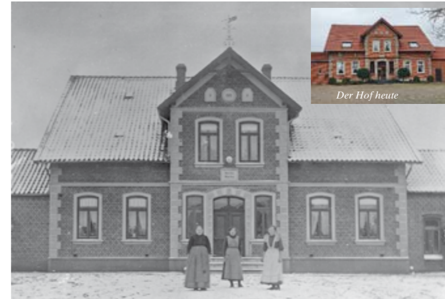
... direkt an der Hauptstraße, heute Hof Meyer-Haase.