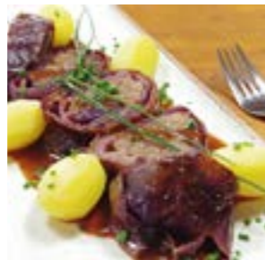
Tipp: Wer es noch etwas cremiger mag, gibt noch einen guten Schuss Sahne zur Sauce und bindet die Sauce mit etwas Speisestärke.