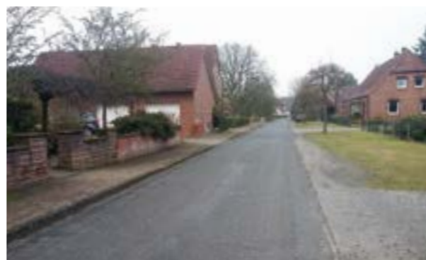
Sandberg im Winter 2022