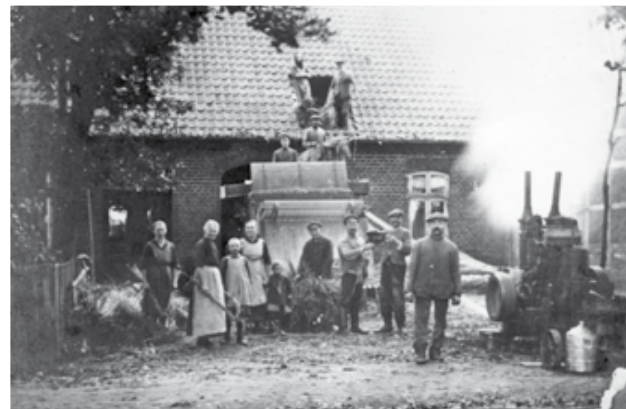
... auf dem Hof Marquardt in der Hainholzstraße in Rethem. Die Firma Hambrock hat zur damaligen Zeit die Dreschmaschine verliehen. Das Dreschen des Getreides gehörte zur Winterarbeit und die gesamte Familie, Nachbarn und Freunde halfen bei dieser Arbeit mit.