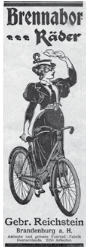
... von 1899 aus der Zeitschrift „Ueber Land und Meer“