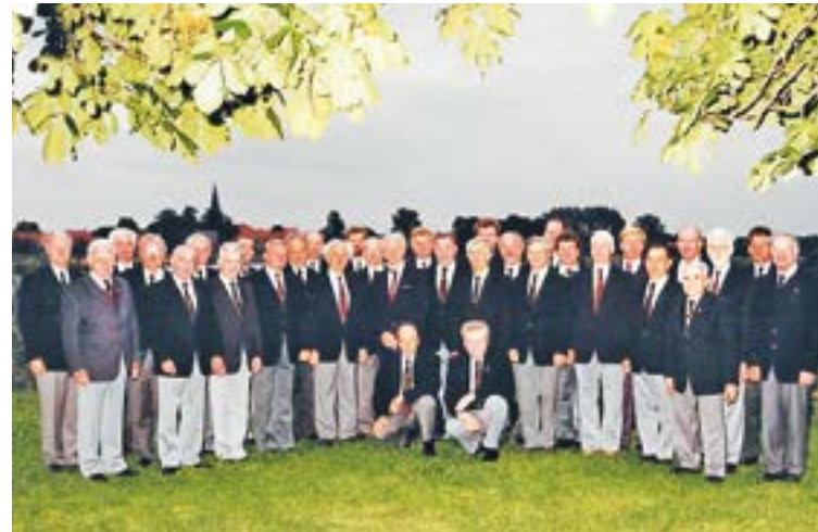
Der Männergesangsverein Mitte der 1990er Jahre in Barne an der Weser