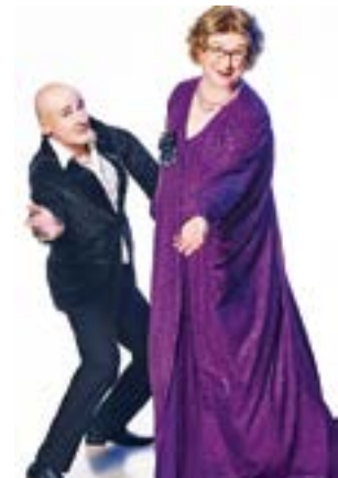
Duo Emmi & Willnowsky

EYSTRUP. Am 26. April 2024 um 19 Uhr gastiert Deutschlands bekanntestes Comedy-Duo Emmi & Willnowsky aus dem Schimid Theater in Hamburg im Alten Güterschuppen in Eystrup mit ihrer neuen „Tour 24“. Ein Frontalangriff auf die Lachmuskeln von der ersten bis zur letzten Minute. Die beiden servieren Gags am laufenden Band, sodass sich die Bühnenbretter biegen. 25 Jahre „Bühnen-Erleben“ als Pianist und alternde Operndiva bietet dafür reichlich Zündstoff.