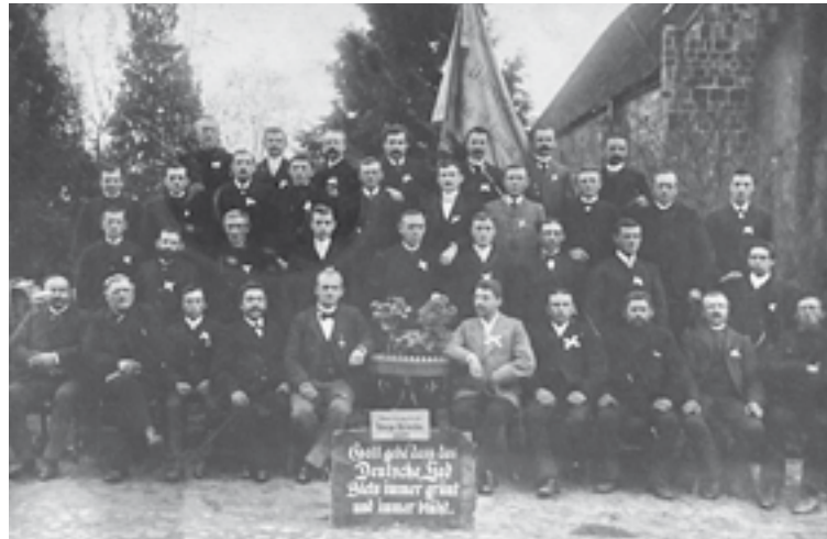
Diese Aufnahme entstand 1897 kurz nach der Gründung auf dem Kirchplatz