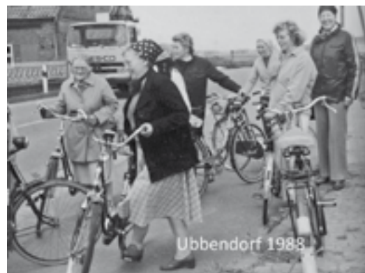
Unterwegs in Ubbendorf, 1988