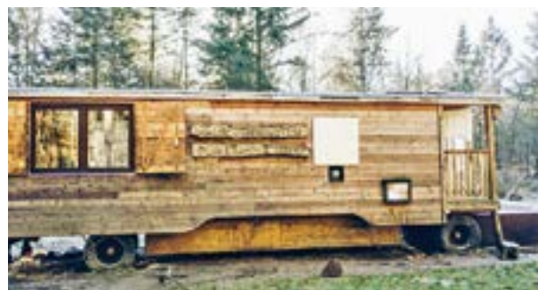
Der Waldkindergarten in Diensthop

Für das leibliche Wohl sowie Spiel & Spaß wird ebenfalls gesorgt sein. Ab der Kreuzung in Diensthop wird der Weg zu un-