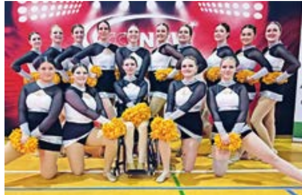
Die stolzen Niedersachsenmeisterinnen auf Erfolgskurs