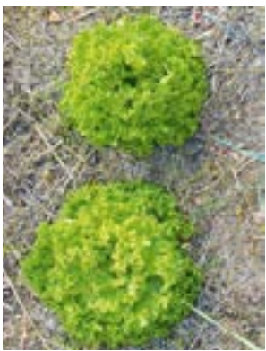
Salat im Mulchbeet