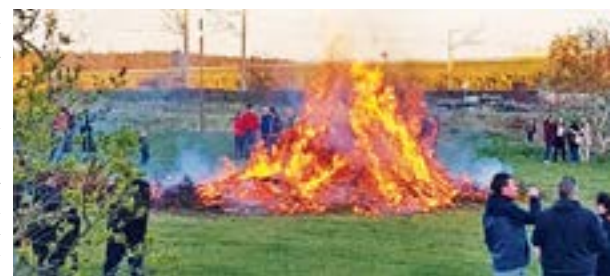
Der Förderverein Handball lädt wieder zum Osterfeuer ein.

EYSTRUP. Der Förderverein Handball in Eystrup richtet wieder das traditionelle Osterfeuer am Karsamstag, den 30. März 2024 aus.