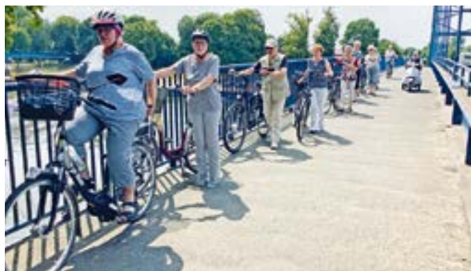
Auf der Brücke in Hoya, 2023

HILGERMISSEN. Sie radeln bereits seit über 45 Jahren durch das Hoyaer Land, um ihre Umgebung zu erkunden. Immer wieder erfreuen sich die Marschenradler über die schönen Orte und Ecken, die die Gegend zu bieten hat. Sie treffen sich in der Zeit von April bis Oktober einmal im Monat, um gemeinsam Rad zu fahren. Termin und Treffpunkt werden eine Woche vorher in der Kreiszeitung bekanntgegeben. Sie treffen sich nach dem Motto, wer kommt, der kommt, eine Anmeldung ist nicht erforderlich. Neue Gesichter sind stets willkommen. Die Fahrstrecken fallen zu Beginn der Saison im April und zum Saisonabschluss im Oktober kürzer aus. Die meisten von ihnen haben zwischenzeitlich E-Bikes, die das Radeln erleichtern. In der gesamten Zeit kam es eher selten vor, dass aufgrund der Wetterlage kurzfristig das Auto genommen werden musste, um die Tour nicht ausfallen zu lassen. Außer kleine Pannen oder die Suche nach dem