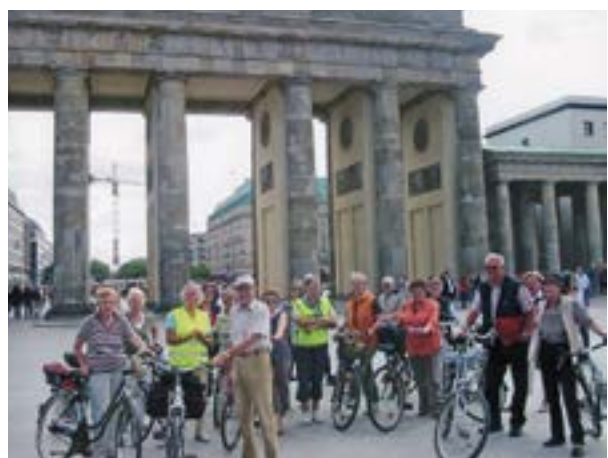
Jubiläumsfahrt mit den Ehemännern nach Berlin, 2008