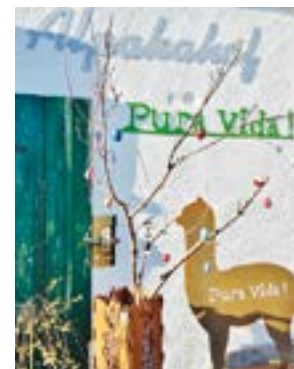
Der Alpakahof bietet Ostersonntag einige Aktionen an. Der Eintritt ist frei.

KIRCHWAHLINGEN. Das Hochwasser geht, die Alpaka-Saison kommt! Gestartet wird auf dem Alpakahof „Pura Vida!“ am Ostersonntag, 31. März. In der Zeit von 11 – 17 Uhr sind die Tore geöffnet, ein breites Repertoire wird geboten: Hausgemachte Blechkuchen, ofenfrischer Flammkuchen und natürlich leckere Bratwurst lassen jeden Hunger vergessen, dazu duftender Filterkaffee und andere passende Getränke. Entspanntes Sitzen im Außenbereich mit Blick auf die Andentiere oder lieber gemütlich warm im alten Kuhstall am großen Ofen. Der Souvenirschop ist geöffnet, alle Fragen rund um die Tiere, ihre außergewöhnlichen Fähigkeiten in der tierge-