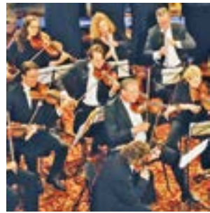
KlangVerwaltung spielt erneut im Kulturzentrum in Hoya

Auf dem Programm steht nämlich u. a. das wohl bekannteste Werk von Antonio Vivaldi, das unter dem Namen „Die vier Jahreszeiten“ den Ruhm des Komponisten entscheidend beeinflusst hat. In der Abfolge von vier kurzen Violinkonzerten wird der Verlauf eines Jahres mit den die jeweilige Jahreszeit prägenden Klängen, Geräuschen und Gefühlen instrumental zum Ausdruck gebracht. Zu Beginn erklingt aber zunächst das Concerto grosso Nr. 7 in B-Dur von Georg Friedrich Händel, bekannt