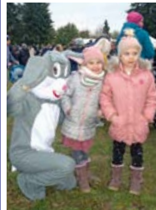
Schon zum 7. Mal findet die beliebte Oster-Eiersuche in Eystrup statt.

beachten, dass kein Wurzelwerk abgeliefert werden darf! Der Förderverein Handball in Eystrup freut sich zahlreiche Besucher und drückt die Daumen für gutes Wetter!