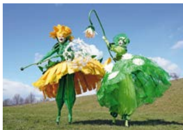
Stelzenläufer gibt es auf dem Weserfrühling zu bestaunen. (Kostüme: ArtTremondo.de)

Um 11.30 Uhr wird der offizielle Live-Teil der Veranstaltung vom Musikzug Hoya eröffnet, der vom Centralplatz bis zum Guderparkplatz und wieder zurück marschiert. Auf der Hauptbühne am