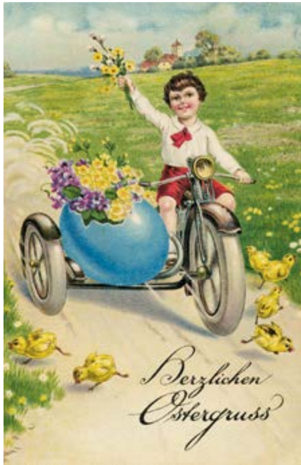
Das Blaue Blatt-Team wünscht mit dieser Ostergrußkarte vergangener Tage aus der Sammlung von W. Rumann allen schöne Osterfeiertage und einen sonnigen Start in den Frühling.

Nr. 2 März/April 2024 www.dasblaueblatt.de 37. Jahrgang