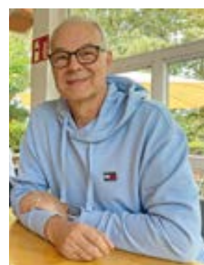
Filmemacher Rolf Zacher

So wurden auch die Künstler in Warpe, Bremen, Berlin, Soest, Nürnberg, Steinbergkirche bei Flensburg sowie Minden besucht und ihre Arbeiten mit der Kamera festgehalten. In den Interviews und Erklärungen vermitteln die Kunstschaffenden Einblicke in die Schaffensphase ihres aufgebauten Kunstwerks am Warper Skulpturenweg. Nach jedem Drehtermin verließ der Filmschaffende tief beeindruckt