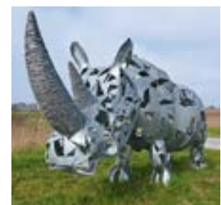
Das Nashorn am Skulpturenweg in Warpe

Der Warper Skulpturenweg wurde im Rahmen einer von 2009 bis 2022 dauernden Flurbereinigung geschaffen und zieht jedes Jahr eine Vielzahl von Besuchern an. Die meisten Gäste von nah und fern bereisen den Weg mit dem Fahrrad. An jedem Kunstwerk gibt ein kleines Hinweisschild Auskunft über den Künstler und sein Werk. Zacher sein Anliegen ist es, den Zuschauern des Films, mehr Hintergrundwissen über die Kunstwerke und die jeweiligen Künstler zu vermitteln. Neben den Objekten zeigt der Film auch einige regionale Besonderheiten, die sich entlang des 16 km langen Warper Skulpturenwegs befinden.