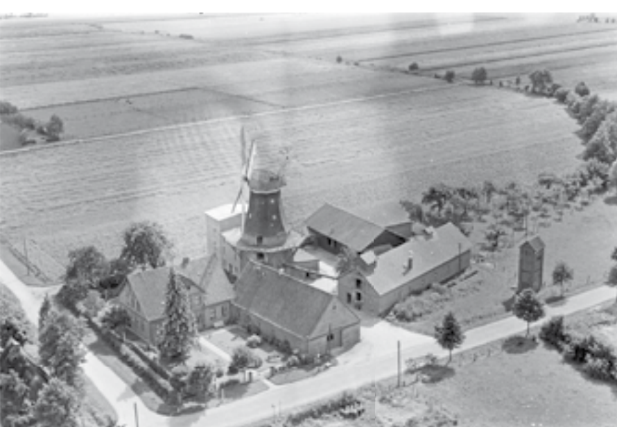
Luftaufnahme von der Eitzendorfer Windmühle vom 17. Juli 1956.