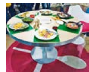
Tisch mit den fertigen Menüs

HOYA. Die Hansestadt Hamburg lockt nicht nur mit Sehenswürdigkeiten wie der Elbphilharmonie, den Landungsbrücken oder dem Museumsschiff Rickmer sondern ist auch Sitz zahlreicher TV-Produktionen. Dazu gehört auch die „Küchenschlacht“, die das ZDF auf dem Gelände Phoenixhof in Hamburg-Altona aufnimmt. 33 Hoyaer LandFrauen durften jetzt bei einer Aufzeichnung dabei sein.