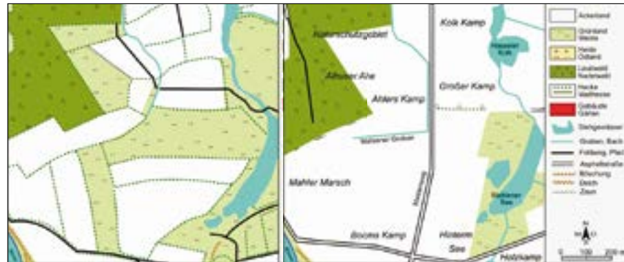
Die Wesermarsch bei Eystrup um 1900 (links) und heute

mit dem Fahrrad kommend. Wie die Alhuser Ahe entstand und die Umgebung im 18. Jahrhundert aussah, geht aus dem Buch über „Die Geschichte der Landschaft im Wesertal bei Bücken“ von Thomas Kausch hervor. Darin werden noch weitere Gebiete bei Altenbücken, Dudenhausen, Schweringen und Warpe in ihrer Entstehung beschrieben und mit Karten und Fotos dargestellt. Wer Lust auf Zeitreisen in unsere Heimatregion hat, kann das Buch im Buchhandel und einigen Geschäften in Bücken erwerben.