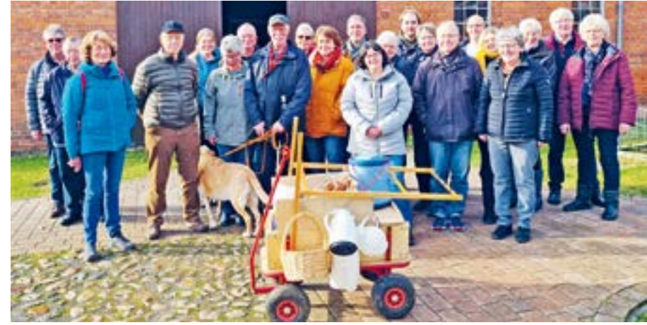
Bei strahlendem Sonnenschein starteten die Nachbarn „Der gemütlichen Ecke“ zur Kohltour.

STEDORF. Am 10. Februar war es wieder soweit: Die Kohltour dabei. Nach einem angelieferten schmackhaften Grünkohlessen bei Meyers, wo diese Treffen dankenswerterweise immer stattfinden, führte die Tour hinter der Schlechtwetterperiode stattgefunden. Um die dreißig Mal haben sie schon diese gemeinsamen Kohltouren unternommen und immer eine Menge Spaß dabei. Nach einem angelieferten schmackhaften Grünkohlessen bei Meyers, wo diese Treffen dankenswerterweise immer stattfinden, führte die Tour hinter der Schlechtwetterperiode stattgefunden. Um die dreißig Mal haben sie schon diese gemeinsamen Kohltouren unternommen