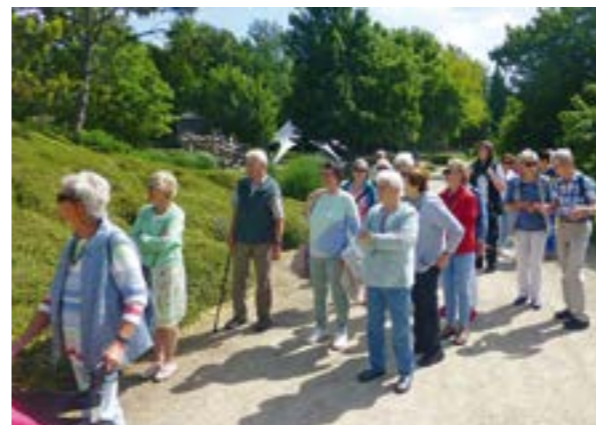
Hoyaer Besuchergruppe während der Führung durch den Park.