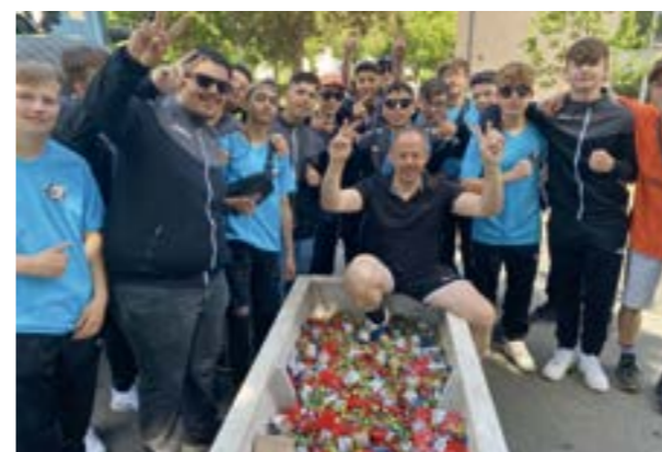
Jede Menge Süßigkeiten wurden beim Umzug verteilt