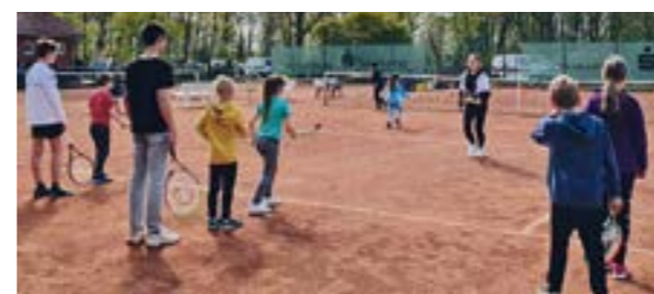
Tennis konnte beim TSV Hassel ausprobiert werden

HASSEL. Die Freiluftsaison der Tennissparte ist mittlerweile wieder mitten im Gang. Sieben Mannschaften messen sich nach zweijähriger Pause nun wieder im Landkreis. Doch ein Highlight stand gleich zu Beginn der Saison an. Das TNB-Mobil vom niedersächsischen Tennisverband war zum Saisonstart mit zwei Trainern und einer Menge Spiel und Spaß für Junge und Erwachsene zu Gast beim Tennisverein Hassel. Es gab zahlreiche Stationen aus Ball- und Geschicklichkeitsübungen verteilt auf zwei Plätzen. Ein Low-T-Ball Feld, zahlreiche Hürden, eine Rückspielstation und viele weitere Highlights haben für ordentlich Abwechslung gesorgt.