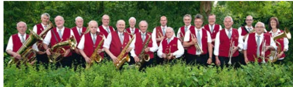
Die Hilgermissen Kolkmusikanten hatten ihren letzten Auftritt am 19. Juni 2022.