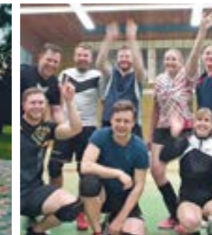
Gemeinsames Training der Damen & Herren