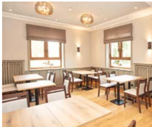
Der Blick in die Gaststube verrät, dass beim Umbau viel Wert auf eine helle, freundlich wirkende Atmosphäre gelegt wurde.

Kneipenbereich ohne eine wirkliche Abtrennung zu haben. Auf Wunsch mehrerer Stammgäste wurden auch wieder die gern genutzten Tresenstühle angeschafft. Mit dem wunderschönen, zentral gelegenen Tresen, hat das Personal die Außenterrasse, den Wintergarten und das Restaurant gleichermaßen im Blick. Geblieben ist der Bierkeller. Das Bierangebot wurde