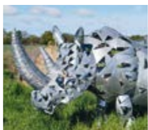
Warum ein Nashorn im Feld steht, erfahren die TeilnehmerInnen von der Gästeführerin

Der Blick über die Welt hinaus ist der einzige, der die Welt versteht Richard Wagner