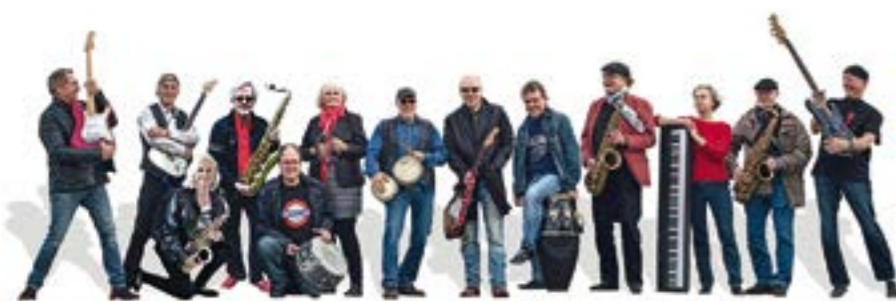
Bremer Rentnerband „NeverTooLate“ spielt im Juli vor dem Alten Eystruper Güterschuppen

EYSTRUP. Sie alle teilen das Alter und die Leidenschaft für Rockmusik mit Mick Jagger und Keith Richards, haben ihnen sogar teilweise gegenüber gestanden. Die Rede ist von den Pionieren der Rock- und Popmusik. Ihre Namen sind den Insidern aus den 60er und 70er Jahren noch bekannt, als die Yardbirds, Steppenwolf oder Deep Purple ihre großen Zeiten hatten. Damals haben zahlreiche Musiker die