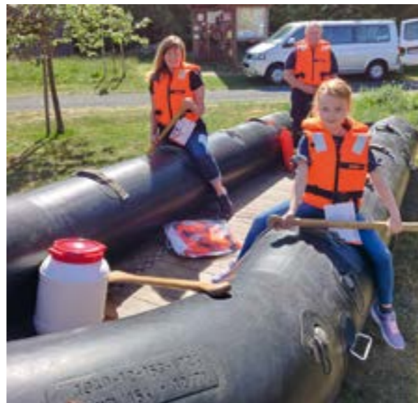
Es wurden auch neue Schwimmwesten angeschafft, die sogleich von einigen Kindern und Betreuern ausprobiert wurden.

Es wird in der Freizeit gemeinsam etwas unternommen, wie Tagesausflüge, Fahrten und Zeltlager, Sport, Basteln und Werken, Umweltprojekte, um nur einige zu nennen. Auch Ausbildungsmaßnahmen für allgemeine Jugendarbeit werden gefördert. Weitere Infos unter www.feuerwehren-doerwerden.de