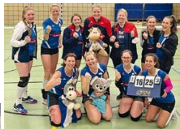
Die erfolgreiche Volleyball-Damenmannschaft

EYSTRUP. Die Sparte Volleyball des TSV Eystrup ist eine der jüngsten und kleinsten Sparten des TSV Eystrup. Um trotzdem attraktiv zu bleiben und eine Teilnahme am Ligabetrieb gewährleisten zu können, haben wir uns vor einigen Jahren mit dem TSV Hassel zusammengeschlossen und eine Spielgemeinschaft gegründet – die VSG Hassel/Eystrup. Unter diesem Namen sind eine Herren- und eine Damenmannschaft erfolgreich unterwegs.