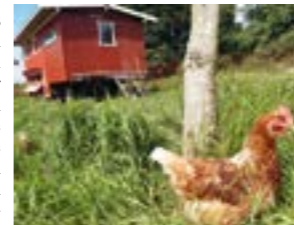
Glückliche Hühner auf dem Hof Friedrichs in Mahlen.

Unter dem Markennamen „Das MahlenEi“ werden die Eier an einem Verkaufsstand in Hassel an der Hauptstraße 39 (bei der ehemaligen Bäckerei) sowie in Eystrup in der Mahler Straße angeboten. Drei verschiedene Nudelsorten aus den eigenen Eiern sowie Kartoffeln ergänzen das Angebot. In zwei selbstgebaute großräumigen Hühnermobilen im Schwedenstil werden artgerecht Freilandier für die