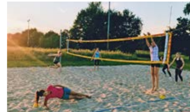
Training auf dem Beachfeld in Eystrup