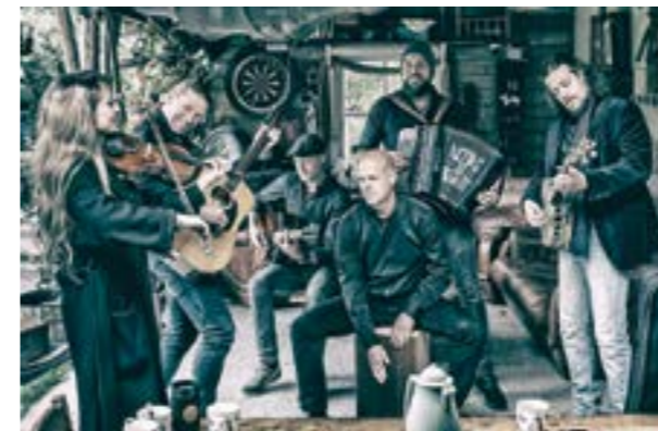
Die Irish-Folk-Band „Acting The Maggot“

Am Samstag, 30. Juli 2022 um 18 Uhr in Haßbergen