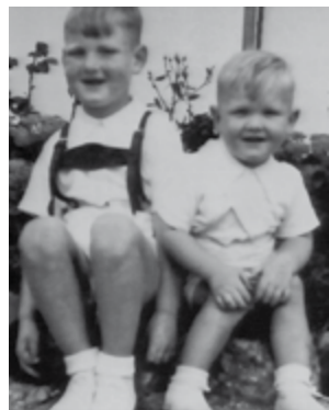
... strahlen im Sonntagsornat vor Mutters grüßenden Blumengarten im Jahre 1953. Inzwischen durften sie wohl reichlich gealtert sein und mit grauen Haaren die Welt anschauen (R. Kl.)