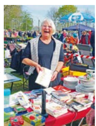
Der Spaß kommt nicht zu kurz

Getränken auch Leckeres vom Grill und Pommes sowie Kaffee und selbstgebackene Kuchen angeboten. Das kulinarische Angebot wird durch Fischbrötchen, Crêpes und verschiedene Eissorten ergänzt, so dass niemand hungrig oder durstig den Heimweg antreten muss. Es wird also für jeden etwas geboten, ein Besuch lohnt in jedem Fall.