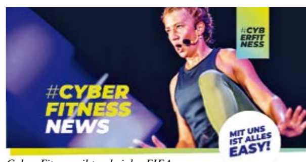
Cyber-Fitness gibt es bei der FIFA

schaft und Wirtschaft. Das Team freut sich darauf, die Leser des „Blauen Blatts“ kennenzulernen und hofft, viele von ihnen bald in der FIFA Fitness-Fabrik begrüßen zu dürfen. Für weitere Informationen und zur Vereinbarung eines kostenfreien Probetrainings besuchen Sie die Webseite www.fifa-fitness-fabrik.de oder kontaktieren Sie die FIFA Fitness-Fabrik per WhatsApp unter 0170/3820592.