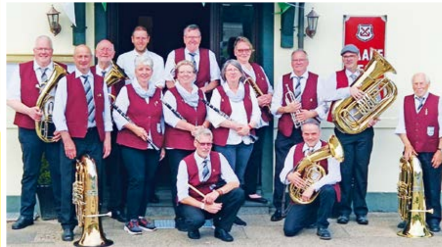
Der Musikzug Uphusen gastiert beim Musikschoppen in Hilgermissen.