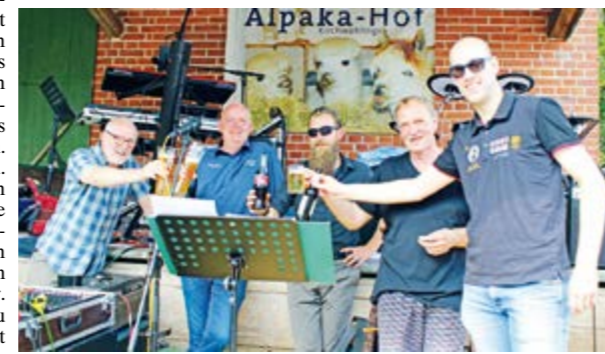
„Alles Echt!“ gastiert am 18. August auf dem Alpakahof