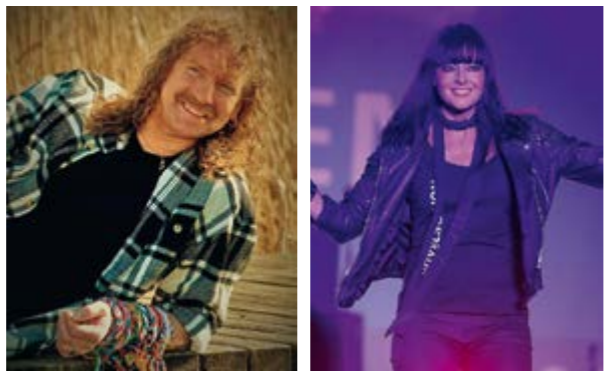
Double Auftritte mit „Wolle Petry“ am Freitag und „Nena“ am Samstag.