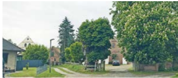
Hier in der heutigen Straße „Im Orth“ wurden 1875 insgesamt 16 Gebäude von den Flammen vernichtet, bei dem es auch ein Todesopfer zu beklagen gab.

WAHNEBERGEN. (rf) In ihrer Ausgabe vom 20. April 1935 berichtete die „Verdener Neueste Nachrichten“ über die Ortschaft Wahnebergen in einem Artikel (zusätzlich heutiger Ergänzungen). Das Dorf Wahnebergen umfasst mit seiner Feldmark 600 ha und zählt rund 350 Einwohner. Die Einwohnerstatistik zeigt, dass der Ort ständig gewachsen ist. Seit 1895 hat die Einwohnerzahl um fast 100 Personen zugenommen. Aus dem früheren Haufendorf zwischen dem Bahnhof und der Gastwirtschaft „Zur Linde“ von Heinrich Winter, wurde eine Streusiedlung, die durch andauerndes Bauen zu einer Straßensiedlung wurde. Auf den ersten Blick zeigt der Ort nichts von seinem Alter. Man glaubt in einer jungen Ortschaft zu sein. Die Bahnhaltstation, der Bahnhof Wahnebergen wurde 1847 eingeweiht. Sauber und freundlich leuchten die Häuser im hellen Backsteinbau. Nur die Dorfstraße ist holperig. Wer strohgedeckte Häuser sucht, der sucht vergebens. Großbrände haben den Ort zweimal heimgesucht und dazu beigetragen, dass das heutige Dorfbild so neuartig ist. Im Jahre 1875 brannten mehrere Höfe, die dicht