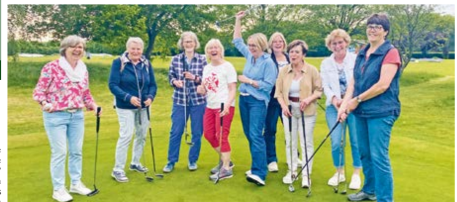
Viel Spaß hatten die Landfrauen beim Golfen

HOYA. Mitte Mai besuchten neun Hoyaer Landfrauen den Golf Club Verden e.V. und absolvierten einen kleinen „Schnupperkurs“. Mit viel Interesse folgten die Frauen den Anweisungen des Golflehrers Mike und hatten viel Spaß dabei. Welche Golfschläger gibt es, wofür nimmt man den Putter und wofür die Wegegolf? Welche Regeln müssen auf einem Golfplatz eingehalten werden? Für das Erlernen von Basics waren zwei Stunden eingeplant. Die Kenntnisse reichten zum Abschluss des Kurses schon für einen kleinen Wettkampf. Bei einem Getränk wurde zum Abschied noch über das Erlernen angeregt diskutiert.