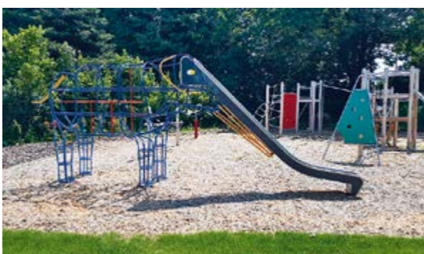
Der Elefanten-Spielplatz in Hoya lädt ein

Nach der Planungsphase ging es im Juni 2023 los. Die Firma Rasche aus Minden startete mit den Garten- und Landschaftsbauarbeiten, anschließend hat die Firma Jenkel aus Bleckede die