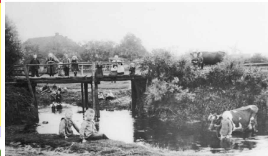
Kinder posieren auf dem Steg. Rechts im Hintergrund ist ganz schwach die 1904 abgebrannte Mühle zu erkennen.