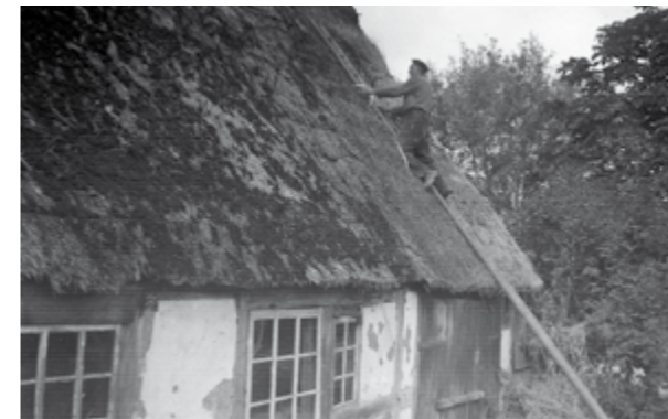
... ca. 1940 am Haus Nr. 66 in Eitzendorf.