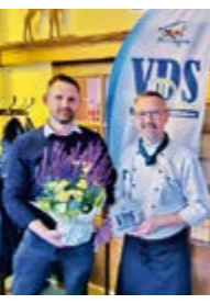
Business-Dämmerschoppen im Gasthaus Waidmannsheil