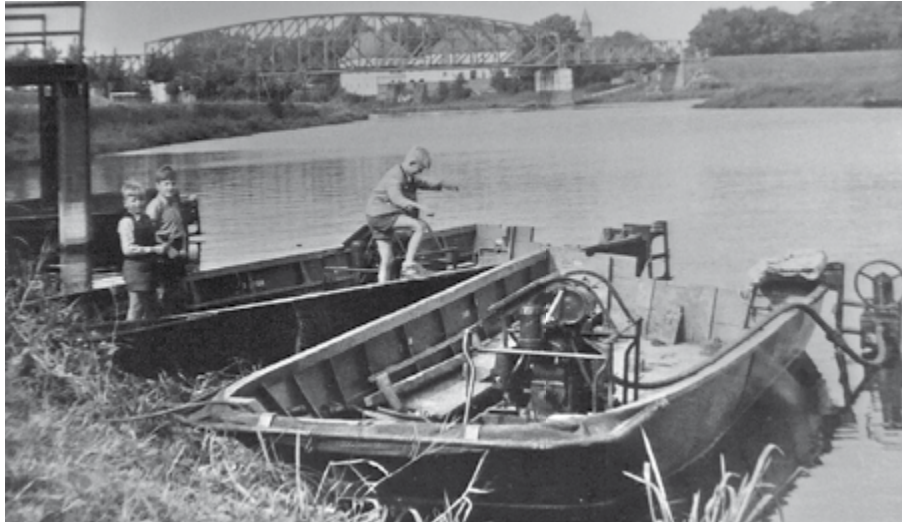
Drei mutige Hoyaer Jungen kaperten im Hafen zwei Boote der englischen Truppeneinheiten, die 1952 im Hoyaer Land Truppen-Manöver abhielten. Landwirte klagten damals über große Schäden, die auf ihren Äckern dabei angerichtet wurden. (R. Kl.)

Ich sende Dir den Duft von Phlox Petunien und Nelken, von Äpfeln, beispielsweise „Cox“ da Früchte nicht verwelken. Ich schicke Dir ein Federchen von meinen Rotschwanzjungen, die in Gebüsch und Zedern schon eifrig mitgesungen. Bind Dir 'nen Immortellenkranz für dunkle Wintertage, dass er Dir von dem Sonnenglanz des nächsten Frühlings sage. So mögen Vogelsang und Duft Dich immerdar begleiten und Sonnenschein samt guter Luft zu allen Jahreszeiten. Eleonore Meyer