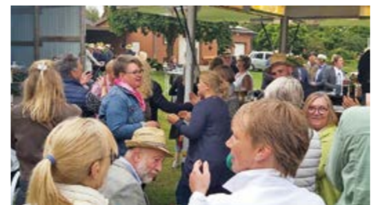
Ausgelassen wird das Königsfrühstück gefeiert

der Musikzug und die Bläser bereits vorher für einen unbestimmten Ort geordert, selbst Fleischer, Bäcker und bestauestattete Getränkeke mit Personal und Bestuhlung warten auf den Einsatz. Nur so wird alle drei Jahre aus einer überraschenden Königsfamilie anlässlich des Königsfrühstücks immer wieder ein überaus gelungenes kleines Schützenfest. Dafür steht der traditionelle Bauern- und Bürgerschützenverein der Samtgemeinde Eystrup!