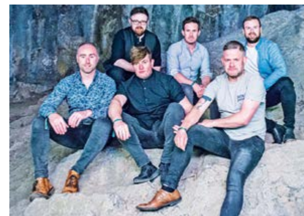
Band „Drops of Green“ aus Dublin