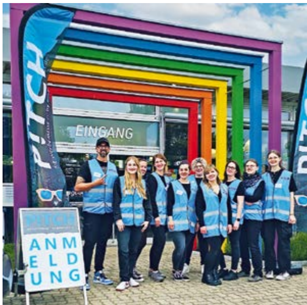
Die „Einfallsgest“ nach der P!TCH-Werbemesse

Themen informieren. Von A wie Akustik, über B wie Beschilderung und Beschriftung, W wie Werbemittel und Websites bis Z wie Zollstöcke. Den Ideen sind keine Grenzen gesetzt. Einfallsgest findet für jedes Problem eine passende Lösung. Durch die Mitgliedschaft im Zusammenschluss „Werbeland“ kann die Werbeagentur in ganz Deutschland tätig werden und findet immer einen passenden Partner, egal um welches Thema es geht. Fahrzeugbeschriftungen und die Produktion des Materials dafür, erstellt die Agentur selbst vor Ort. Zusätzlich können vor Ort Tapeten oder Sportplatzbanden gedruckt und produziert werden.