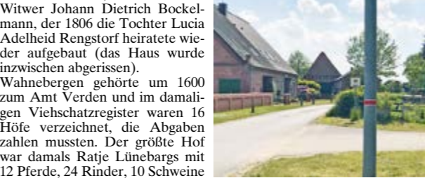
Durch ein Großfeuer, das ein Blitzeinschlag verursachte, wurde es erst möglich den bis dahin engen Verbindungsweg nach Stedebergen so zu verbreitern, dass dieser auch mit Gespannen befahren werden konnte.

bis zur Burgbergfähr, der wurde von Kirchgängern und Konfirmanden aus Ahnebergen, Stedebergen und Wahnebergen die zur St. Andreaskirche in Verden gehörten, gerne genutzt. Bis zum Bau der Allerdeiche im Jahr 1872 wurde Wahnebergen bei jedem Hochwasser zur Insel, dann mussten auch die Leichen per Boot nach Verden geschifft werden, um auf den Domsfriedhof bestattet zu werden, da es in Wahnebergen noch keinen Friedhof gab. Auf Initiative des Verdener Landrates Seifert, wurde 1908 der 1,5 Kilometer lange Verbindungsweg, zwischen Wahnebergen und Stedebergen der „Stedeberger Weg“ mit Brücke angelegt, der auch mit Pferdegesspannen zu befahren war. Vorher musste ein Umweg über die heutigen B 215 und K 14 von 3,5 Kilometer gemacht werden, um zum Wahneberger Bahnhof zu gelangen, zumal vorher auch der Entwässerungsgraben (Wahneberger Graben) die Durchfahrt blockierte.