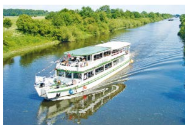
Fahrgastschiff MS „Stadt Verden“

NIENBURG/VERDEN. Die Flotte Mittelweser bietet zwischen dem hessischen Bad Karlshafen und der Hansestadt Bremen in seinem Fahrplan von mehreren Standorten aus ein breit gefächertes Angebot an Rund- und Linienfahrten an. Zur Flotte im Mittelweser-Bereich gehören die Schiffe MS „Stadt Verden“ und das Fahrgastschiff „Bremen“. Genießen Sie in den Sommermonaten die kleinen Wesertouren,