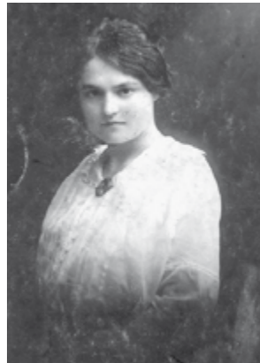
... im Jahr 1915, aufgenommen im Fotostudio des KaDeWe in Berlin.