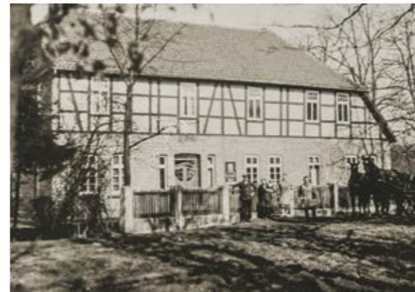
Das Gasthaus Waidmannsheil um 1930. Die Struktur des Hauses ist bis heute erhalten geblieben. Damals kamen die Gäste noch mit Pferdekutschen.

sich Rosemarie um die Küche und den Haushalt sowie später um die drei Kinder gekümmert. 1967 erfolgte die Vergrößerung durch den Anbau des Clubzimmers.