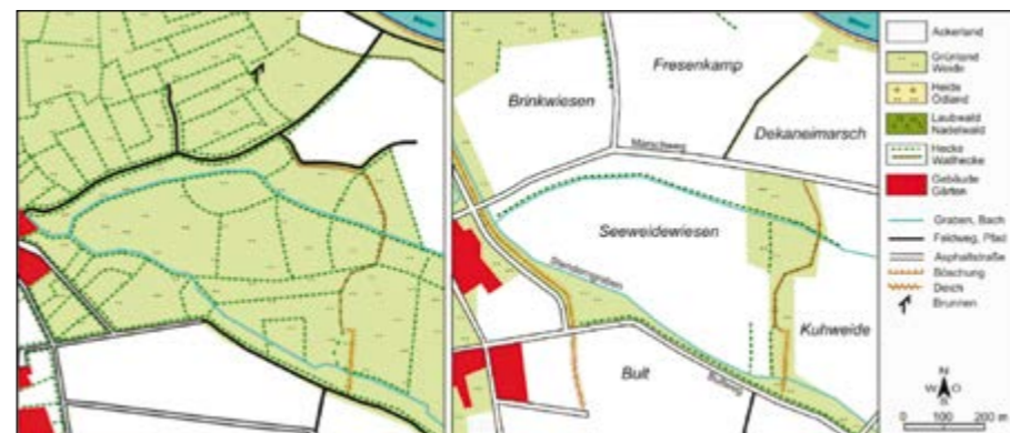
Die Wesermarsch bei Altenbücken früher (links) und heute