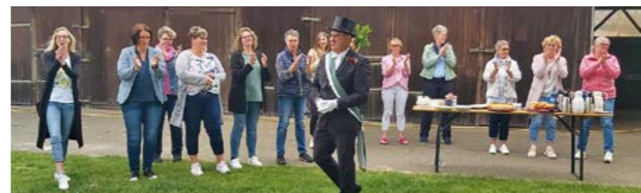
Viele fleißige Helfer/Innen im Hintergrund ...

EYSTRUP. Das Königsfrühstück des Bürgerschützenvereins Samtgemeinde Eystrup gehört zu den Höhepunkten des Schützenfestes, da der Ablauf traditionell ein ganz besonderer ist: Der neue König wird am gleichen Abend und natürlich früh am nächsten Morgen schlägt ein kompetentes und erfahrenes Team mit dem Vereinsfestausschuss und den umtriebigen „Ehrendamen“, sprich Partner/innen bei der Königsfamilie auf, organisiert und hilft bei der Vorbereitung. Natürlich sind auch