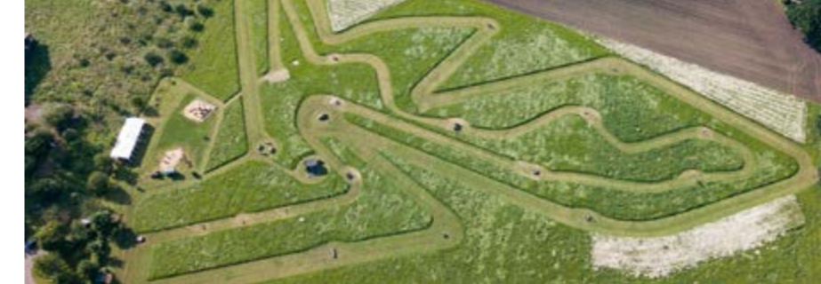
Luftbild der Bauerngolf- und Fußballgolfbahnen

Jahr sogar online gebucht werden. Aber natürlich werden die Reservierungen auch weiterhin telefonisch oder per Mail angenommen. Weitere Informationen gibt es auf der Homepage unter www.hof-claus.de oder per Telefon unter der 05022-363.