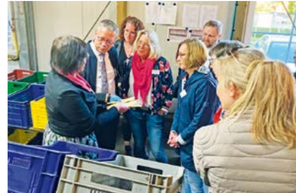
Hof Alhusen informiert über die Spargelproduktion