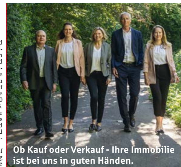
Ob Kauf oder Verkauf - Ihre Immobilie ist bei uns in guten Händen.