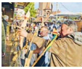
Die VDS besuchte die diesjährige Domweih in Verden

Am Dienstag, den 4. Juni 2024, traf sich eine kleine, aber feine Gruppe der Mitglieder der VDS zum fröhlichen Rundgang über die Domweih. Trotz der überschaubaren Teilnehmerzahl hatten alle Anwesenden viel Spaß und nutzten die Gelegenheit, sich sportlich zu betätigen – besonders das Bogenschießen erfreute sich großer Beliebtheit.