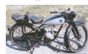
Technische Daten: 98 qcm, 3 PS, 2-Gang, 69 kg, 55-60 km/h, 1,9 L/100km, Bereifung 26x25,0, produziert 1936-1953.

Inne Sömmertied na Fierabend hebbt sik de jungen Lüe jümmer mol bi Tron's ünner de Linnen ane Stroten droppen. Düttmal wür Anni toerst da, tein Minuten later köm Anton mit siene blank putzte 98er NSU anknattern un pulter glieks los: „Anni, ick well morn na Bräm'. Wult du mit, bi mi upn Sozius?“ Anton wör soon ganz sien', mit'n Bügelfalte inne Büxen un siene Gamaschen, de uppe Schau stöten, wörn jümme an glänzen. Anni wör as lütje Deern mal in Bräm' wesen, aber dat wör all lange her. „Wo wullt du denn dor henn? woll se wäten. „Na de Stadthalln. Dor is ne Utstellung von de väln Kooptlie. Dor gift dat bannig väl to probeern. So recht wat för so'n Leckeremuhl as du!“ „Anton, aber du musst mi verspreken, dat du suutsche feuerst. Ick bün jo soon bäten een Bangbök.“ „Na goot, denn feuer ick upn Hennweg in' ersten Gang un upn Nahusweg in' tweeten.“ „Worum denn no Hus sone Jageere?“ „Dat is wie bi joen Schimmel. De loppt nahus jo ok jümmers in Drapp.“