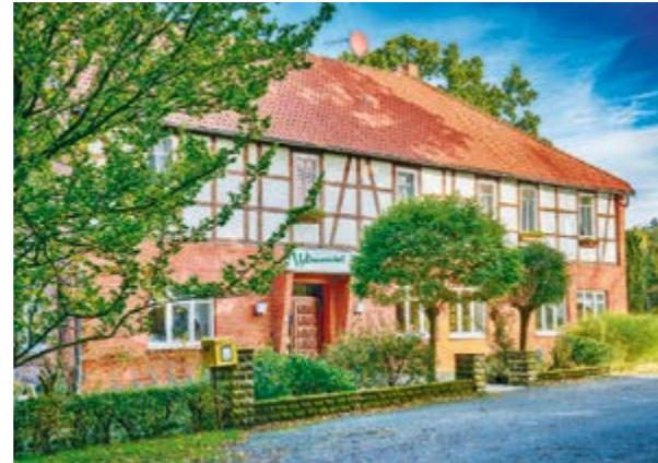
Das idyllisch gelegene Gasthaus Waidmannsheil mitten im Grünen gehört zu einem der ältesten Landgasthäuser in der Mittelweser-Region.

Die beiden waren sehr geschäftstüchtig und haben die Räumlichkeiten des beliebten Ausflugslokals erweitert. In der Schankerlaubnis von 1930 für die vergrößerte Gaststube mit Clubzimmer heißt es: „Auf-