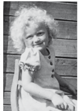
... später verheiratete Dietrich ca. 1949 in Hoya.