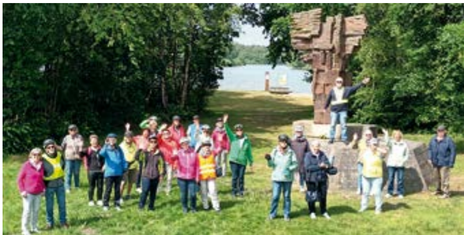
Radtour Cloppenburg – hier an der Thülsfelder Talsperre vor der Skulptur „Die Friedensretter“.

HOYA. Über 13.000 km erradelten die Hoyaer LandFrauen im Sommer 2024 gemeinsam. Ob Tages- oder Mehrtagestouren, die Radtouren dieses quirligen Vereins erfreuen sich ungebremster Beliebtheit. Den Start machte im Mai die dreitägige Radtour nach Rotenburg an der Wümme. Das Reisegepäck gut in den Satteltaschen verstaut, starteten die LandFrauen in Hoya. In Intschede wurde die Weser überquert und dann ging es durch unberührte Natur entlang des Wümmeradweges bis in die Kreisstadt im Elbeweserdreieck. Die Wümme war auch am zweiten Tag ständiger Begleiter, als es über Scheeßel in den „Landpark“ in Lauenbrück ging, einem