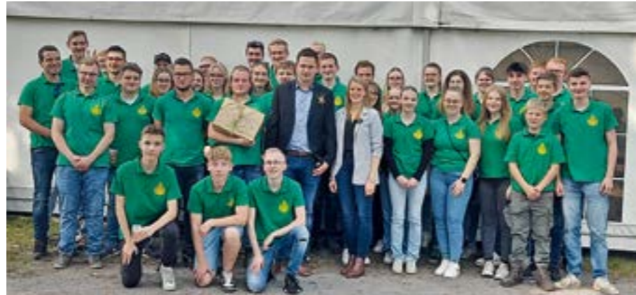
Die Erntejugend Hämelhausen, hier auf dem Foto aus 2023, freut sich auf das diesjährige Erntefest und viele Besucher.

Familie Hilker gesprochen. Und ab 20.00 Uhr findet die Zeltparty mit DJ Torben vom Event DJ Team statt. Der Erntecub und der Schützenverein Hämelhausen-Hohenholz hoffen auf eine große Beteiligung.