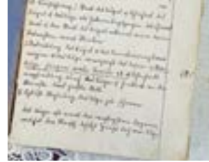
Aufsatzheft aus dem Jahr 1924 ... in Sütterlin geschrieben

Ereignis an jenem Abend auf dich gewirkt haben! Ich gebe zu: Nie habe ich bisher eine Schnepfe gesehen, geschweige denn dass ich weiß, „wie“ man sie schmackhaft zubereiten könnte (z.B. „Schnepfe vom Rost“, nach altem Wiener Kochbuch). Aber immerhin: Mein Interesse an Schnepfen wurde durchs Lesen geweckt! Oder als weiteres Beispiel noch zum Inhalt des letzten (und des ersten aus dem Jahre 1925; „den 10.1.25“) Aufsatzes, in dem der „Erbkönig“ von Moritz von Schwind beschrieben wird. Wie stellt dieser romantische Maler in seinem Bild den Erbkönig dar? Ich kannte bisher das Bild nicht, ich