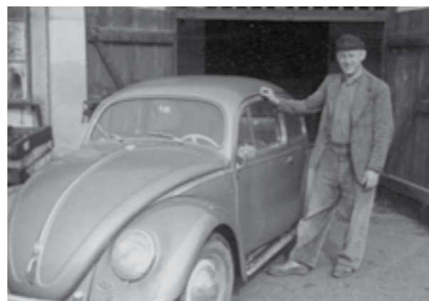
... 1954 in Eystrup mit seinem ersten Auto. Als er noch kein Auto hatte, ist er mit seinem Motorrad zu den Baustellen gefahren.