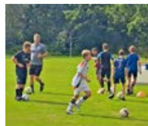
Die Kids hatten viel Spaß bei der Ferienpassaktion

WESTEN. In den Sommerferien fand im Rahmen der Kinderferienaktion der Gemeinde Dörverden mit dem JFV Aller-Weser ein bunter Fußballtag statt, der mehr als 30 begeisterte Kinder anlockte. Die Veranstaltung, die auf der großzügigen Sportanlage des TSV „Jahn“ Westen stattfand, bot den jungen Sportlern die Möglichkeit, ihre fußballerischen Fähigkeiten an verschiedenen Stationen zu verbessern und sich in einem freundschaftlichen Wettkampf zu messen. Die Kinder durchliefen mehrere Übungsstationen, die sowohl technische Fertigkeiten als auch Teamarbeit