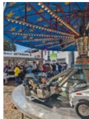
Fahrgeschäft am Zwergenbrunnen

Standbetreiber 4,- Euro/Meter. Als gewerbliche Anbieter gelten solche, die ein überwiegend homogenes Warenangebot haben, z. B. Kleielektronik und Zubehör, neuwertige Bekleidung, Tonträger, Bücher und Comics, hochwertige Antiquitäten, Serienspielzeug. Weiter geht es am Sonntag, den 22. September 2024 mit dem Herbstmarkt, ebenfalls in der Lange Straße. Die Besucher erwarten ein vielfältiges Angebot an Speisen und Getränken, eine Regio Meile mit einer vielfältigen Produktpalette aus naher Umgebung, Kinderspaß, Walking Acts und Live Musik am Centralplatz. Die Veranstaltung beginnt ab 11 Uhr und zum Auftakt wird der Musikzug Hoya um 11.30 Uhr vom Guder Parkplatz zum Centralplatz marschieren. Die Besucher dürfen sich über ein Platzkonzert an der Bühne freuen. Weiter geht es auf der Bühne mit der jungen Rockband „Lost phantomzz“ und ab 15 Uhr wird die „Martfelder Blues Band“ erwartet. Die Einzelhändler öffnen ab 12 Uhr ihre Türen und bieten den Gästen in der Stadt die Möglichkeit für einen ausgiebigen Shopping.