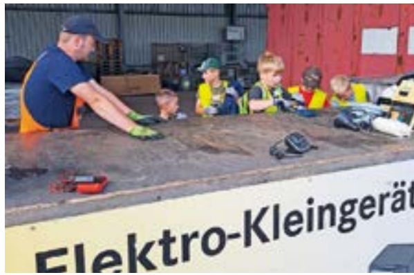
Kinder sortieren eifrig den Elektro-Schrott.

NIENBURG. Elektrogeräte sortieren, Müllfahrzeugen beim Abladen zusehen und eine Runde Discgolf auf Nienburgs höchsten Berg spielen – so ein Tag beim BAWN ist abwechslungsreich. Gleich zwei Ferienpassgruppen waren zu Besuch beim Betrieb Abfallwirtschaft Nienburg/Weser (BAWN) und haben dort einiges erlebt. Insgesamt 16 Kinder wollten gerne hinter die Kulissen des Betriebs gucken. Nach einer Führung durch das Entsorgungszentrum in der Krähe durften die Schüler sogar selbst anpacken: Gemeinsam mit den BAWN-Kollegen haben sie Elektro-Schrott vorsortiert. Denn Akkugeräte, alles mit einem Stecker und Batterien gehören bereits vor dem Weitertransport getrennt. Kein Problem für die neuen Abfall-Experten, die viel Spaß bei der Aktion hatten. Zur Stärkung ging es anschließend auf die Kräher Höhe. Dort haben die Kinder gemeinsam nachhaltige Beutel gestaltet. Auf eine Seite malten sie ein „Mensch-ärgere-dich-nicht-Spiel“ – so haben sie immer gerne hinter die Kulissen des Betriebs gucken. Nach einer Führung durch das Entsorgungszentrum in der Krähe durften die Schüler sogar selbst anpacken: Gemeinsam mit den BAWN-Kollegen haben sie Elektro-Schrott vorsortiert. Denn Akkugeräte,