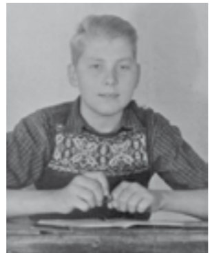
... als Schüler 1952 in Hämelhausen.