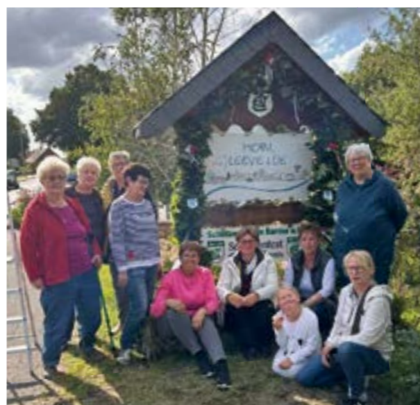
... haben zum Schützenfest die Dorfeinfahrt mit einer Girlande geschmückt. Die Geselligkeit und der Spaß kamen dabei nicht zu kurz.