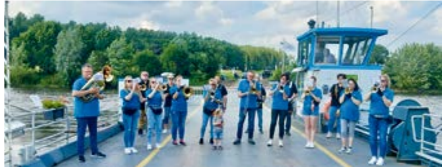
Musikeinlage „Wo die Weser einen großen Bogen macht“ auf der Schwenninger Fähre

LEGO-Flohmarkt nach Vereinbarung 04234-2691