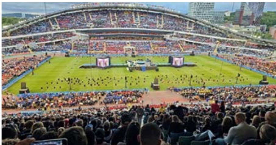
Das gut gefüllte Stadion in Göteborg zum Gothia-Cup

tag das erste leichte Training, um das Team auf die bevorstehenden Herausforderungen vorzubereiten. Die Gruppenphase begann am Montag und endete am Mittwoch mit gemischten Ergebnissen: Ein 3:1-Sieg gegen ein schwedisches Team, eine knappe 0:1-Niederlage gegen eine schottische Mannschaft und eine 0:2-Niederlage gegen das favorisierte schwedische Auswahlteam, was am Ende den 3. Platz in der Gruppe und das Weiterspielen in der Trostrunde bedeutete.