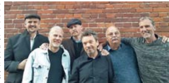
Die „Martfelder Blues Band“ gastiert in Hoya

HOYA. Am traditionellen Katharinenmarkt Wochenende organisiert die Veranstalter Fördergemeinschaft Hoya e.V. die Veranstaltungen am 21. und 22. September 2024 in der Innenstadt. Den Auftakt bildet der Flohmarkt am Samstagmorgen von 9:00 – 14:00 Uhr in der Lange Straße. Der Vorverkauf der Standplatzreservierungen beginnt am Samstag, den 7. September, ab 9 Uhr in der Buchhandlung „Leserei“, Lange Straße 14, Hoya. Die Standgebühr beträgt für alle gewerblichen Anbieter 8,- Euro/Meter und alle privaten