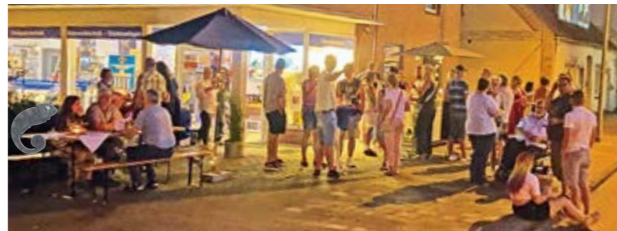
Nettes Beisammensein in Rethem auf dem Weinabend 2023.

RETHEM. Am Freitagabend, den 6. September 2024 lädt die Werbegemeinschaft Rethem aufgrund der gelungenen Veranstaltungen in den letzten Jahren nun zum dritten Weinabend ein. Die