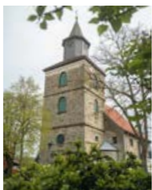
Martinskirche Hoya, ehem. Grafenkirche

In Eystrup sind beispielsweise das Industriedenkmal Senffabrik Leman und das Motorradmuseum „Im 2-Takt“ (Alexanderweg 75) von 10 bis 18 Uhr geöffnet. Hier werden alte Dampfmaschinen in Betrieb genommen und historische Technik zu neuem Leben erweckt. Auch die Hochzeitsmühle „Margarethe“ (Mühlenstraße 11) ist von 14 bis 17 Uhr geöffnet. Die Mühle kann im Betrieb erlebt werden. Allorts werden Sondervorführungen nach Bedarf angeboten.