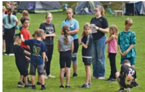
Die Kids verbrachten ein abwechslungsreiches Sportcamp

HASSEL. Wir schreiben Freitag, den 21. Juni im Jahr 2024. Ein ungewohnter Start für die 34 Betreuer und Betreuerinnen des Sportcamps 2024, welches gewöhnlich immer am Mittwoch anfängt. Genau um 14 Uhr sammeln sich die Betreuer und Campmutter an der Sporthalle und dem Sportplatz Hassel, um die letzten Vorkehrungen zu treffen, bevor die Teilnehmer des Sportcamps 2024 eintreffen und beginnen ihre Zelte aufzubauen.