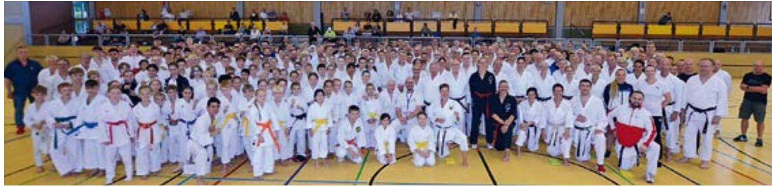
Volles Haus in Dörverden: Mehr als 330 Karatekämpfer und zahlreiche Zuschauer kamen am 17. August nach Dörverden

DÖRVERDEN. Über 330 Karateka aus ganz Niedersachsen und den angrenzenden Bundesländern trafen sich am 17. August in Dörverden zum 13. Verbandstag des Karateverbandes Niedersachsen (KVN). Die Karateabteilung des TSV Dörverden richtete diesen KVN-Tag bereits zum vierten Mal aus. In der Wesersporthalle wurden insgesamt 15 Seminare angeboten, neben Karate auch Stock-