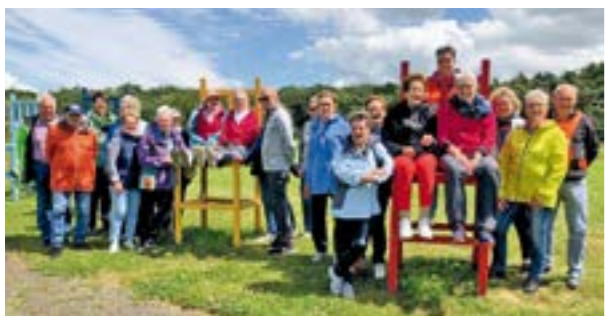
Überraschungsradtour – hoch oben auf dem Berg der Mülldeponie Krähe.