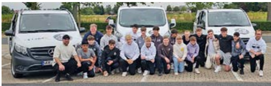
Das Team startete die Reise mit drei gesponserten Kleinbussen