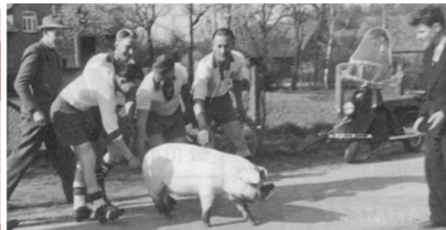
Dieses Schwein war der Lohn für das siegreiche Hasseler Team 1957 in Martfeld.

und seinem Team – wer es nicht abwarten kann, stillt den Hunger mit einer Wurst.