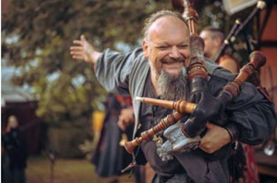
Comes Vagantes spielen am Samstagabend auf dem Katharinenmarkt zum Konzert.