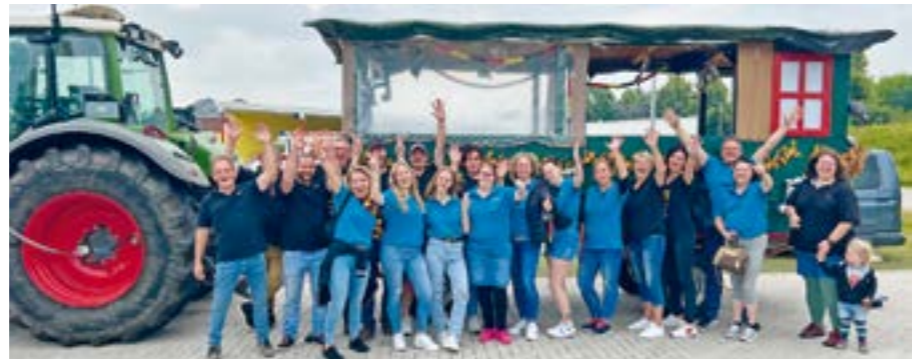
Viel Spaß hatte die Musikgruppe bei der Planwagenfahrt.