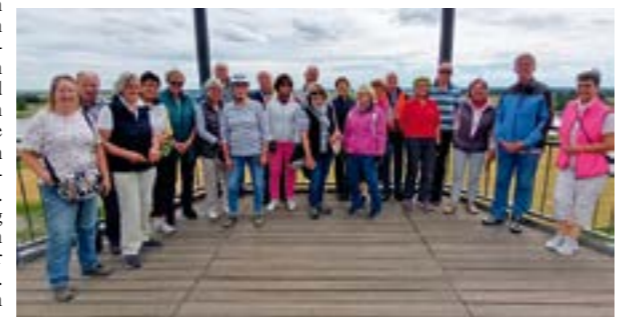
Radtour Tangermünde – auf einer Aussichtsplattform hoch über der Elbe.

deutschlands, der Plattenburg, konnte sogar eine Verbindung zu Hoya festgestellt werden, denn die letzten Burgherren der „von Saldern“ siedelten nach dem zweiten Weltkrieg in die heimische Weserstadt um. Das Schloss Zerben, einem Standort des Projekts „FrauenOrte“, in dem die Lebenswerke starker Frauen geehrt werden, sowie die Stadt der Türme „Burg“ und das Wasserstraßenkreuz in Magdeburg standen am Abreisetag auf der Agenda. „Überraschung“ hieß es anlässlich einer Tagesradtour im Juli, denn nur die Organisatoren kannten Strecke und Ziel dieser Radtour. Tief verhüllt in Regenkleidung trafen sich die Radler und Radlerinnen an der Stiftskirche in Bücken. Das Portal bot vorerst genug Schutz vor Nässe, bevor kurz vor dem Start der Regen nachließ und das erste Ziel, das Café auf dem Hof Bünkemühle in Helzendorf angesteuert wurde. Beim gemütlichen Frühstück regnete es nochmals. Vier Tage radeln im idyllischen Elb-Havel-Winkel, das hatten sich Mitte Juni 22 LandFrauen mit ihren Partnern auf die Fahnen geschrieben. Einen ersten Eindruck der in der Prignitz und Uckermark vorherrschenden Backsteinromantik erhielten die Radler und Radlerinnen am Startpunkt, dem ehemaligen Prämonstratenserkloster Jericho. Durch Biosphärenreservate ging es vorbei am Geburtsort Otto von Bismarcks und der Grablage der „von Katte“ bis Tangermünde. Havelberg mit dem imposanten Dom sowie dem „Haus der Flüsse“ waren weitere Ziele. An der ältesten Wasserburg Nord-