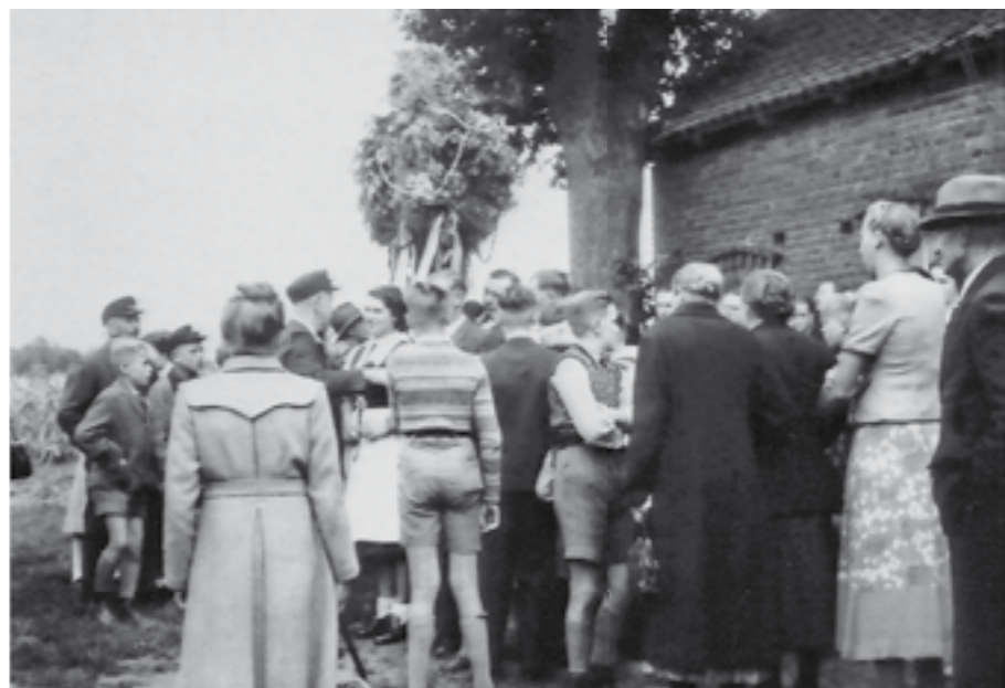
Jung und alt ist auf den Beinen, um gemeinsam das Erntefest zu feiern.