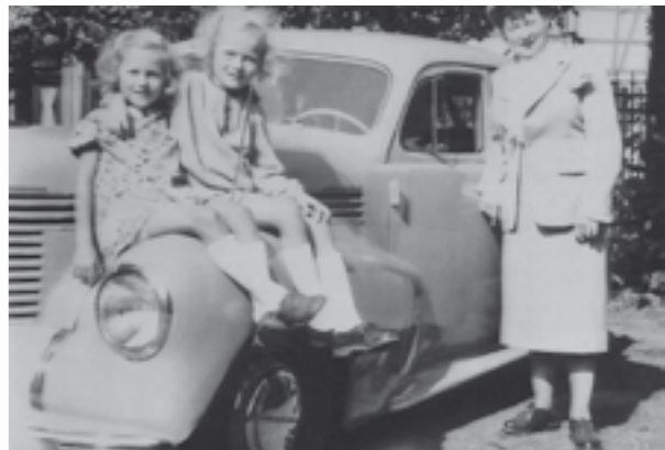
... freuen sich auf die Sonntagsausfahrt mit dem schicken Wagen ihrer Tante ... R. Kl.