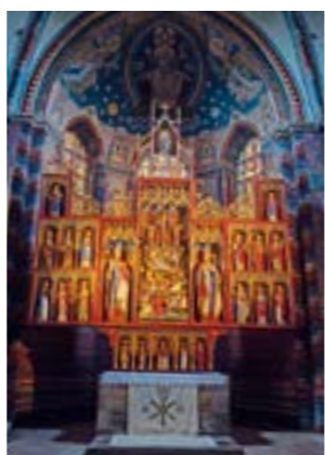
Altar Stiftskirche Bücken