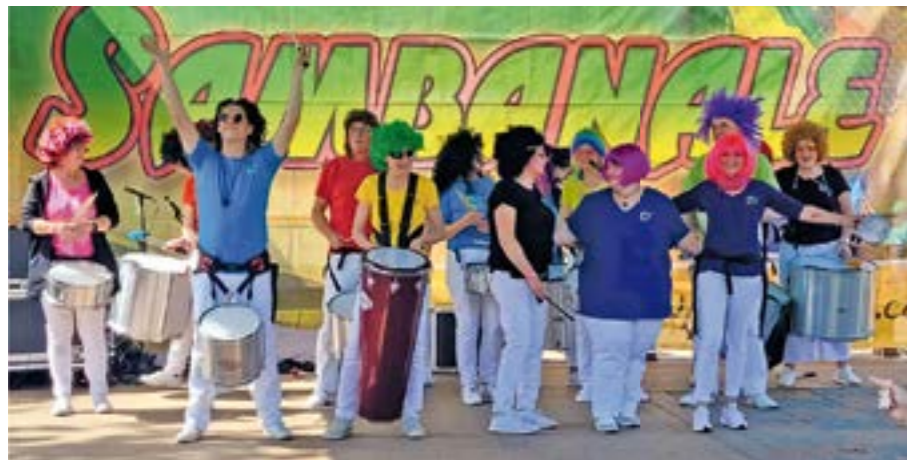
Die Sambagruppe „Banda Colorada“ aus Thedinghausen wird für Stimmung sorgen.

Verkaufsoffener Sonntag, Jazz & Blues und Ökomarkt Verden