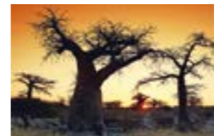
Impressionen aus Afrika ...

tierbestände Afrikas. Das Ziel der Bilderreise sind die legendären Victoria Fälle in Simbabwe, die größten Wasserfälle der Welt. Eintrittskarten gibt es im Vorverkauf für 12,- Euro (Abendkasse 15,- Euro) zu den geltenden Coronaregeln in Eystrup bei der Raiffeisen-Genossenschaft, der Volksbank und der Shell-Station sowie Kartenreservierungen unter Telefon 04254-802323.