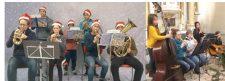
Neben den Jungbläsern sind auch u.a. Flöten, Xylophon, Gitarre und Kontrabass zu hören