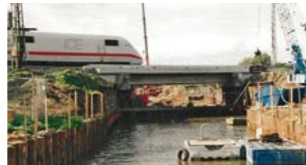
Die Unterführung im Oktober 1999. Der erste ICE überquert die neue eingeschobene Brücke über die Kreisstraße 14. Trotz der damaligen trockener Witterung sieht es hier eher nach einer Brücke über einen Kanal aus.