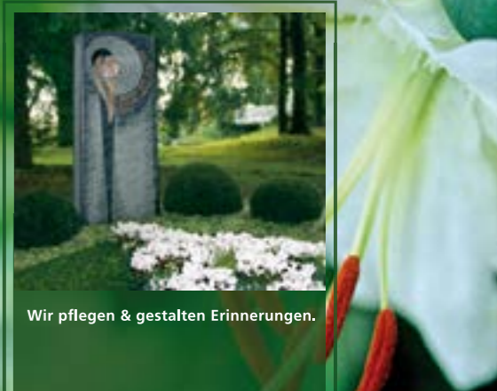
Wir pflegen & gestalten Erinnerungen.

Dauergrabpflege von Ihrem Friedhofsgärtner: liebevoll, kreativ & verlässlich ...in Hoya, Bücken, Hassel und Eystrup