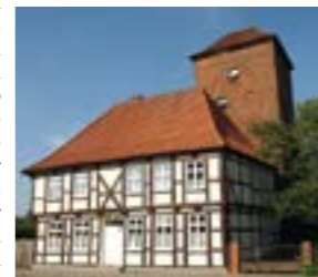
Das Scharfrichterhaus mit Turm.

Sonntag, 27. November „Stadtrundgang durch die Norderstadt“