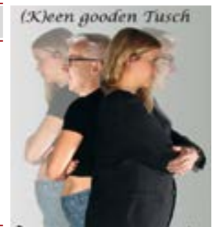
Bis zum Ende bleibt es spannend, ob und für wen es (k)ein guter Tausch wird.

unter www.Stedorfer.Theaterbuehne.de. Die Veranstaltung findet auf dem Kulturgut Ehmken Hoff in Dörverden statt.