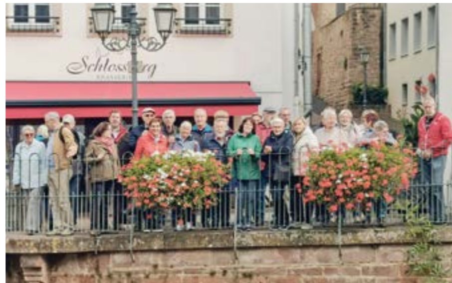
Die Reisegruppe in der Altstadt von Saarburg am Wasserfall