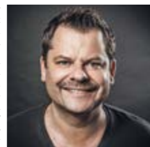
Ingo Appelt

EYSTRUP. Am 24. November 2022 um 19 Uhr tritt Ingo Appelt im Alten Güterschuppen in Eystrup auf. Wenn er kommt, haben die Nörgler Sendepause! Ingo Appelt hat ein Geheimrezept gegen die deutsche Depression erfunden: Es gibt so lange auf die Zwölf, bis die Sonne wieder scheint. Schmerzen werden weggelacht. Schon ein einziger Besuch seines neuen Programms „Der Staatstrainer!“ ersetzt mehrere Jahre Therapie- und zwar für Männer wie für Frauen! Denn Ingo Appelt gibt der allgemeinen Miesepetrigkeit den Rest- zur Not mit einem gezielten Tritt in den Arsch. Es kann so einfach sein. Natürlich bekommen auch die ach so