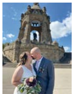
Fotoshooting vor dem Kaiser-Wilhelm-Denkmal