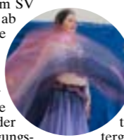
Orientalischer Tanz für Mädchen

Frauen und Mädchen ab 13 Jahren statt. Tanzinteressierte kleiden sich bequem und bringen wenn möglich ein Hüfttuch mit.