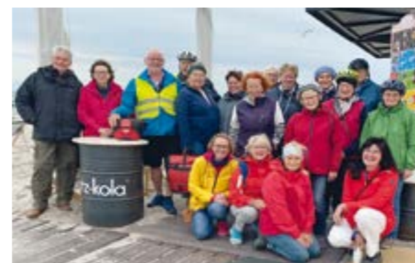
Reisegruppe 2 am Süstrand.