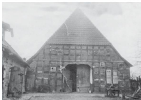
... in Barne, Barner Kirchweg 8, wurde 1948 abgerissen.