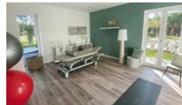
Die Behandlungsräume sind großzügig und durch die bodentiefe Fenster lichtdurchflutet. Sie bieten sowohl für den Patienten als auch für die Therapeuten eine wohlige Atmosphäre.