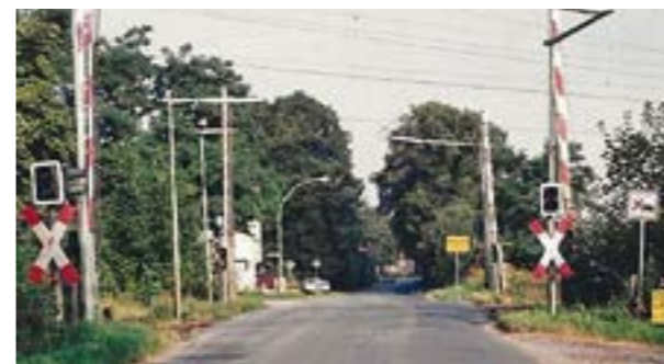
So sah der ehemalige beschränkte Bahnübergang aus Richtung Ahnebergen aus.