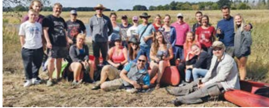
Die Karateka verbrachten einen tollen Tag bei bestem Wetter

DÖRVERDEN. Ihren Trainingsauftritt nach den Sommerferien verbrachten die Karateka des TSV Dörverden ausnahmsweise nicht in der Sporthalle. Statt dessen trafen sie sich zu einer gemütlichen Kanutour auf der Aller. Von Bosse aus ging es gut 15 Kilometer bis nach Hülsen, wo die Tour mit einem zünftigen Grillabend abgeschlossen wurde. Neben dem tollen Gemeinschaftserlebnis genossen die Kämpfer auch die ruhige Natur und konnten zahlreiche Wildgänse beobachten, die sich bereits für ihren Weg in den Süden sammelten. Bemerkenswert, allerdings im negativen Sinne, war die Erfahrung, wie wenig Wasser die Aller Ende August führte. Nicht nur an den Ufern konnte man dieses beobachten, auch mitten in der Aller musste schon mal ausgestiegen werden, um das eine oder andere Kanu zu Fuß wieder in die wasserführende Rinne zu setzen, da es mittig auf Grund gelaufen war.