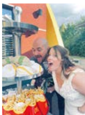
Schlemmen bei Mc Donald's in Porta Westfalica