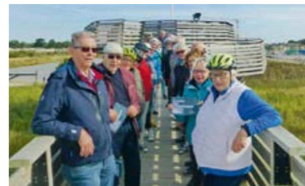
Reisegruppe 1 vor der Aussichtsplattform auf der Baustelle des Fehmarnbelt-Tunnels.

HOYA. Als „sturmfest und erdverwachsen“ bezeichnet Hans Grote die Niedersachsen in dem „Lied der Niedersachsen“ aus dem Jahre 1926. Dass diese Eigenschaften der Realität entsprechen, bewiesen im September