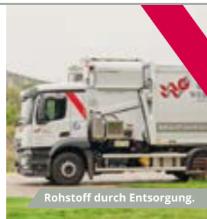
Rohstoff durch Entsorgung.

Entsorgung und Verwertung Altpapier Akten Bauschutt Kunststoffe Folien Reststoffe