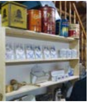
Die Ausstellung beschäftigt sich in diesem Jahr mit dem Motto „Oma's Haushalt“.

30.10.2022 von 11.00 Uhr bis 17.00 Uhr besuchen. Die Kalibstube kann ebenfalls an diesen Tagen besucht werden. Mit einem gemütlichen Zusammensein mit Feuerkörben an den Buden wird der Samstagabend ausklingen. Am Sonntagnachmittag wird auch Kaffee und Kuchen im Angebot sein. Die Kinder können die Spielzeugbörse besuchen. Stattfinden wird das alles in den z.T. über 300 Jahren alten ehemaligen Schafställen in dem unter Denkmalschutz stehenden Schafstättviertel in Hülsen am Schützenweg. Ein Ausflug nach Hülsen wird sich auf jeden Fall lohnen.