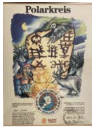
Zertifikat für die Überquerung des Polarkreises

An dem Tag – das Jahr kann ich nicht erinnern – war es wohl auch, dass ich Zeuge eines einmaligen Ereignisses wurde. Und während ich dieses schreibe, kommen mir fast Zweifel, ob ich's so wirklich erlebt habe! Mir fiel eine mehrere Meter lange Rampe auf, dicht an den gähnenden Abgrund gestellt, um die sich schon viele Menschen zu sammeln begannen. Was sollte das werden? Kurz darauf zeigte sich ein junger Motorradfahrer in voller Montur mit seinem leichten Gefährt, auf dem er, als die stauende Menge den Weg freigegeben hatte, aus angemessener Entfernung Kurs auf die Rampe nahm, über die er dann mit beschleunigter Geschwindigkeit in hohem Bogen hinwegschoß und – weit über die Kante fliegend – im grauen Nichts verschwand ... Ein kleines Boot konnte ich tief unten auf den leichten Wellen schaukeln sehen, offenbar in Warteposition. Welchen Blick müssen die Leute im Boot auf die steil aus dem Meer aufragende Wand gehabt haben, vor der sich im rasenden Fall Fahrer und Motorrad, koboldhaft verkleinert, der Oberfläche des Meeres entgegenschossen.