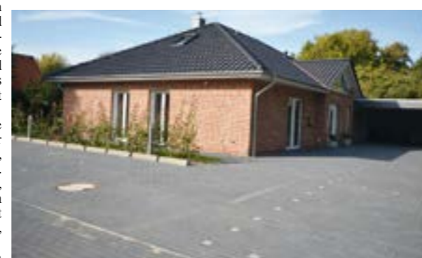
Viele Patienten kommen mit dem Auto oder werden gebracht. Schon aus diesem Grund wurde viel Wert auf eine große und gute Parkfläche gelegt. Alles wurde sehr komfortabel angelegt.

DÖRVERDEN. Nach fast 22 Jahren in der Neuen Reihe 8a wechselt die Praxis für Physiotherapie ihren Standort. Genau vor einem Jahr wurde das Grundstück ausgehoben, nun nach einem Jahr ist das neue Haus in Stedorf, Zu den Kämpfen 1 fast fertig. Nach zwei Jahrzehnten Mietzahlung wollten Corinna und Ehler Troue etwas Eigenes schaffen. Dieses Eigentum wollten sie ganz individuell, zeitgerecht und behindertengerecht gestalten. Das ist ihnen mit dem neuen Objekt sehr gut gelungen.