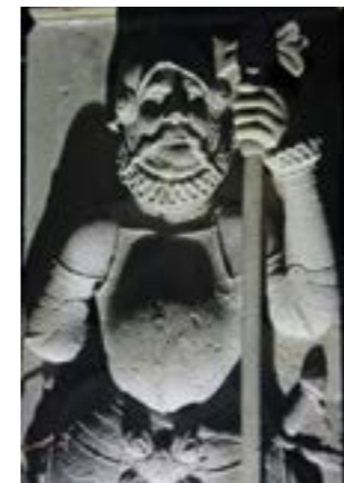
Ritter am Carl-Hatzky-Weg bei Nacht, (Foto: Annkathrin Sommer/Bildarchiv der Stadt Verden)

Sonntag, 23. Oktober „Schrecklich-schöne Schauermärchen“