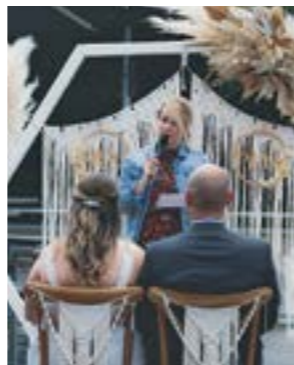
Die freie Trauung ...