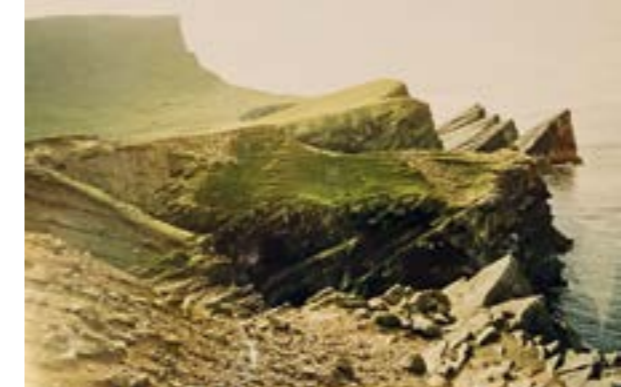
Kliffküste auf Foula in Großbritannien

Wortmaterial auf Norwegen. O, ein Individuum, wenn auch mit gewissen Gemeinsamkeiten, sie sind ja so etwas wie eine Familie. Wie bei der Familie kann der Inselname vieles über die Bedeutung, über seine Herkunft sagen. Assoziativ kann er oft bestimmte Vorstellungen wecken ... Wie vielfältig sind die Umrissformen der Inseln, deren Formen – rund oder länglich im einfachen Fall – weitgehend geschlossen oder buchtenreich gegliedert, häufiger geradezu zerlappt und zerfressen sind. Foula kommt mir vor wie ein Pfannkuchen, dessen Ränder in der Pfanne unregelmäßig zerlaufen sind. Abgelegenheit vom Festland ist für den Besucher immer ein Vorteil, je weiter desto mehr! Denn in der Abgeschiedenheit kann er Ruhe und Erholung finden und meist schon auf der Anreise seine Sorgen, die ihn gerade noch beschäftigt haben, für eine bestimmte Zeit abschütteln! Man ist reif für die Insel! Kurt Sindel