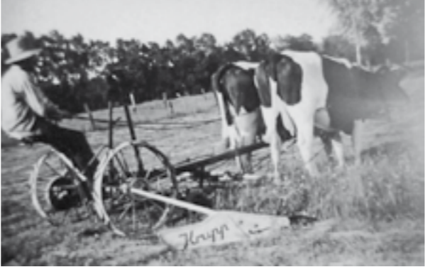
... vor vielen Jahrzehnten.