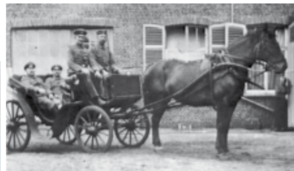
... in den ersten Weltkrieg (1914-18) ziehen mussten, kam im Herbst 1915 aus dem Einsatzgebiet Flandern diese Karte in die Heimat und sollte wohl zur Beruhigung beitragen. R. Kl.