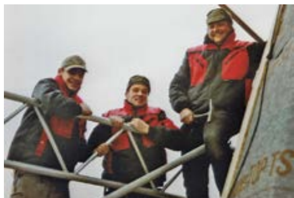
... gab es im November 1998 für diese wackeren Dachdeckergehilfen bei der Reparatur an der defekten Kirchturmspitze der altherwürdigen Hoyaer Martinskirche, die einige Tage in Anspruch nahm. Allein der Aufbau des Baugerüsts in derart luftiger Höhe war schon ein Meisterstück. Belohnt wurden sie mit einer einmaligen Rundumsicht.