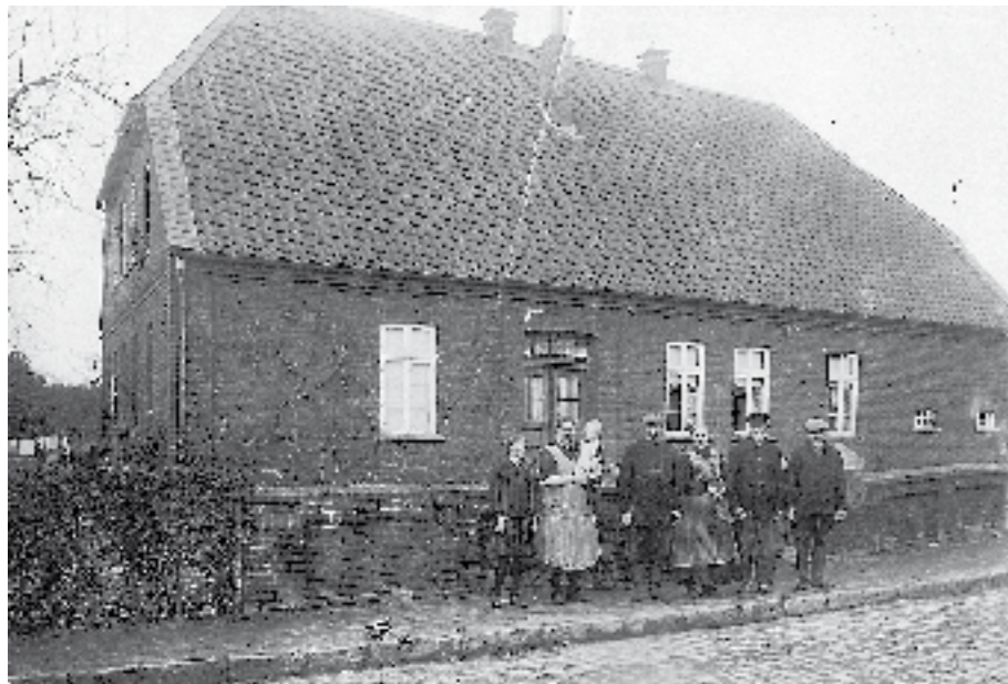
... in der Bäckerstraße vor über 90 Jahren

Raiffeisen-Warengenossenschaft Niedersachsen Mitte eG ECHT. STARK. NAH.