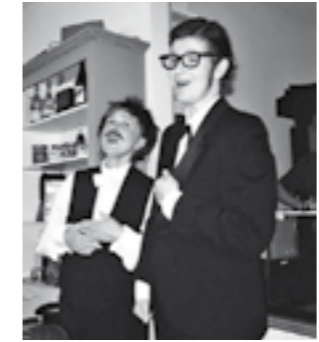
Wiener Liederabend in der Alten Kapelle am 11.11.23