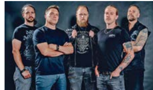
Dead Rock Pilots

VERDEN. Der Kaufmännische Verein zu Verden e.V. präsentiert das fünfte Street Food Festival in der Innenstadt - Street Food frisch zubereitet auf die Hand in den Mund sowie den Verkaufsoffener Sonntag von 13 bis 18 Uhr Am 5. November werden in der