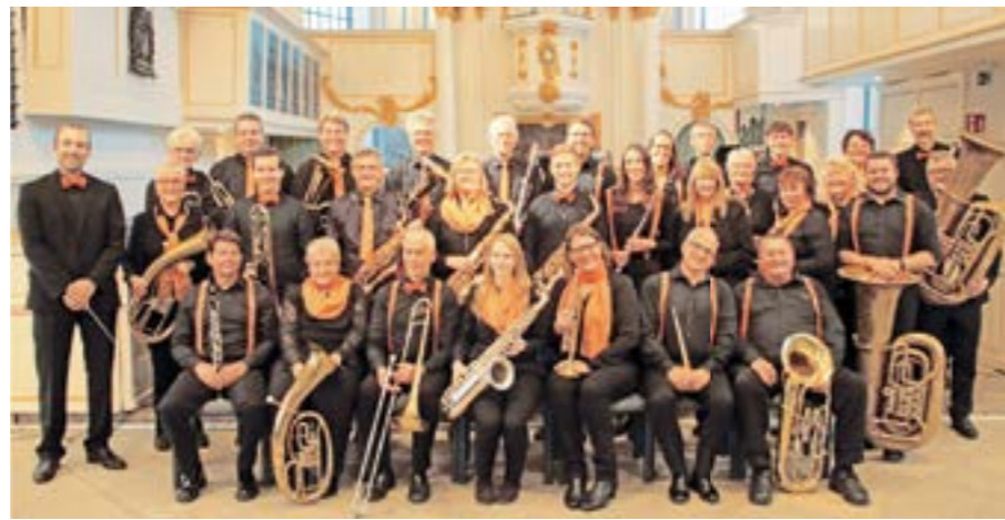
Das Verdener Bläserorchester spielt am 25. November im Kulturzentrum Martinskirche in Hoya