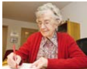
Ihr Wille zählt. Mit einer Patientenverfügung und einer Vorsorgevollmacht können Sie dafür sorgen, dass es auch so bleibt.

HOYA. Am Dienstag, den 24. Oktober bietet der ASB in seiner Tagespflege, Lange Straße 143, um 18.30 Uhr einen kostenlosen Vortrag zum Thema „Gut vorgesorgt: Patientenverfügung und Vorsorgevollmacht“ an. Schon in gesunden Tagen lässt sich festlegen, was (medizinisch) geschieht, wenn man einmal entscheidungsunfähig werden sollte und wie wichtig eine solche Vollmacht für den Ernstfall sein kann, dass können die Gäste in dem etwa 1 ½-stündigen Vortrag erfahren. Anschließend gibt es die Möglichkeit Fragen zu stellen oder sich mit anderen Interessenten auszutauschen. Die Teilnahme an der Veranstaltung ist kostenfrei; aus Planungsgründen wird aber um eine vorherige Anmeldung gebeten: Telefon: (04251) 4419-820 oder tagespflege-hoya@asb-nienburg.de