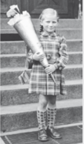
(später verheiratete Richarz) bei ihrer Einschulung 1953 vor der Schultreppe in Eystrup. Das Kleid für die Einschulung hat Schneider Kortebein genäht.

Wenn Sie eine verantwortungsvolle Position suchen und dazu beitragen möchten, unsere Mietobjekte im Eystruper Umland bis einschließlich Bremen in bestem Zustand zu halten, freuen wir uns auf Ihre Rückmeldung. Kontaktaufnahme gerne über Tel.: 0172 3890481 oder info@oengel.de