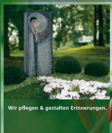
Wir pflegen & gestalten Erinnerungen.

Dauergrabpflege von Ihrem Friedhofsgärtner: liebevoll, kreativ & verlässlich ...in Hoya, Bücken, Hassel und Eystrup