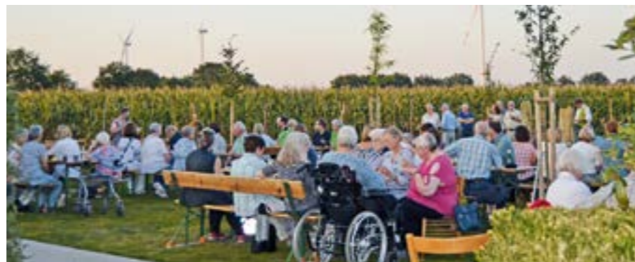
Viele Besucher nahmen an dem Gemeindefest zur Paradieseinweihung teil.