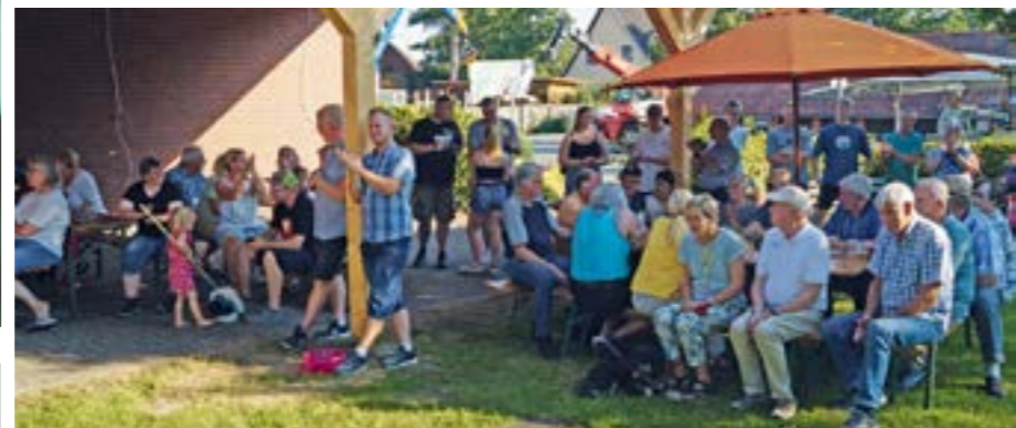
Der SC Gandesbergen hat ein tolles Dorffest gefeiert

GANDESBERGEN. „Vom Dorf – fürs Dorf“ unter diesem Motto stand das sportlich-spaßige Jubiläumfest in Gandesbergen anlässlich des 40-jährigen Bestehens des Sportclubs Gandesbergen. Dass der eher kleine Verein auf die Hilfe der anderen ortsansässigen Vereine, der Gemeinde und verschiedener Spender zählen konnte, bewies sich eindrucksvoll