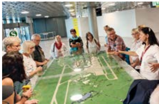
Auf dem Foto sind einige der Gäste um das Modell des Flughafengeländes zu sehen.

HOYA. Was haben die LandFrauen und der Airport Hannover gemeinsam? Auf diese Fragen bekamen jetzt 30 LandFrauen mit Partnern bei der Entdeckungstour über den Flughafen Hannover eine Antwort: „Die Biene!“. Für die LandFrauen ist sie das Verbandszeichen, für den Airport Hannover ist „Follow-Bee Frida“ ein lustiges Maskottchen, das als Wegweiser die Besucher über das