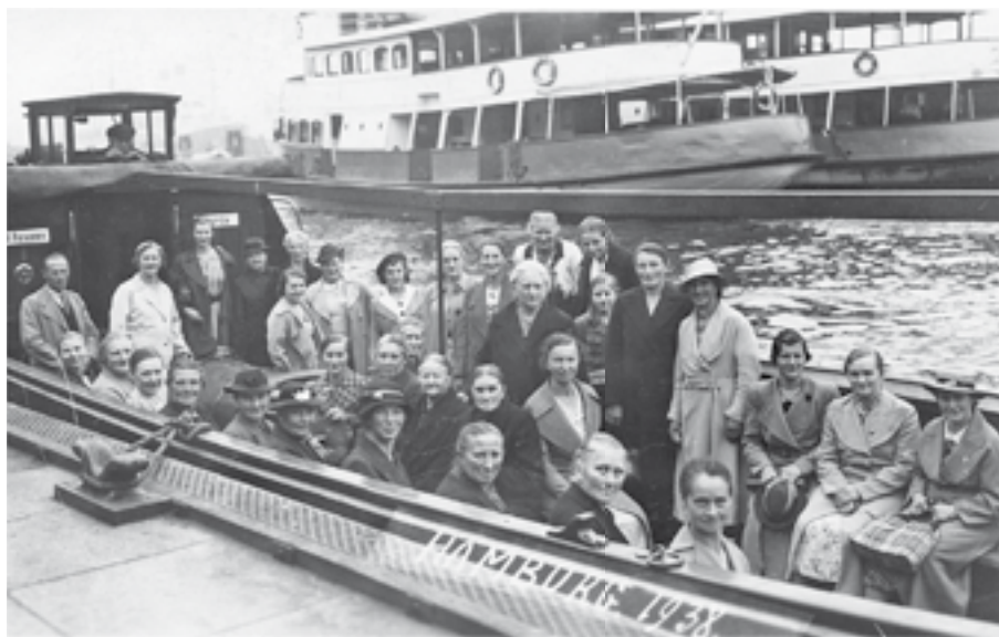
... nach Hamburg mit Hafenerundfahrt.