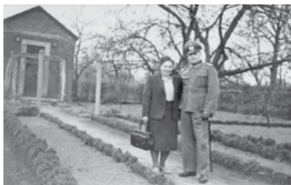
... vor vielen Jahren in der Bäckerstraße, Eystrup. (Bildsammlung Christa Nienierza)