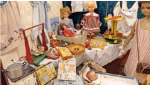
Kinder-Spielzeug aus früheren Zeiten gibt es im Wecholder Heimathaus zu entdecken.