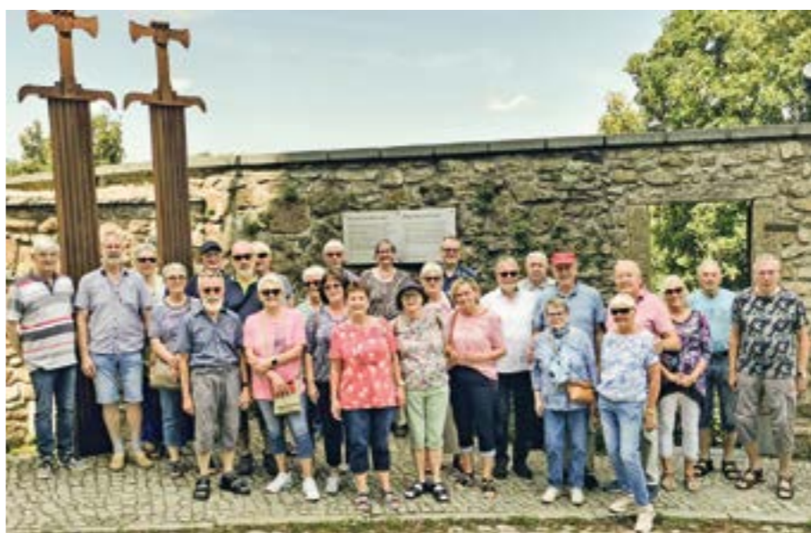
Die Gruppe besuchte die Außenanlage der Ortenburg in Bautzen, wo im Jahre 1018 der Frieden von Bautzen zwischen dem Heiligen Römischen Reich und Polen geschlossen wurde.