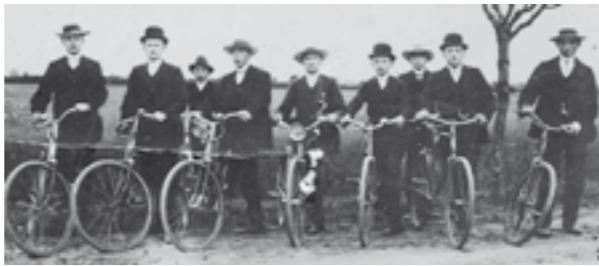
Der Stedorfer Radfahrverein „Wanderlust“

den, so empfiehlt sich sofort nach dem Aufbrühen abgossener und wenig versüßter schwarzer Tee, der angenehm schmeckt und leicht anregt. Hat man den Tag über sehr viel getrunken und ein schweres Gefühl im Magen, so thut ein Teelöffel doppelkohlen-saures Natron ausgezeichnete Dienste. Bei starker Ermüdung kurz vor dem Ziel – aber auch nur dann, ist ein Kognak oder irgendein Schnaps unbezahlbar. Während der Fahrt sind alle alkoholhaltigen Getränke indes das reinste Gift. Die Hauptmahlzeit verlegt man am besten auf den Abend resp. auf die Zeit, wo man das Tagespensum absolviert hat. Niemals darf man sofort nach der Mahlzeit weiter radeln. Morgenstunde hat Gold im Munde, jede Stunde vor acht Uhr Morgens ist für den Radler schöner und vorteilhafter, als zwei Stunden nach acht. Wer um fünf auf dem Rade sitzt, um zehn sein Morgenpensum absolviert hat, bis fünf rastet und dann wieder bis acht oder neun Uhr radelt, der wird Genuß, körperliches und geistiges Hochgefühl von seiner Radreise haben und in bester Kondition wieder daheim anlangen.