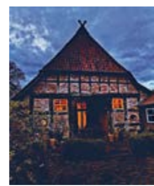
Am 3. Dezember lädt Westen zum „Advent in den Höfen“ ein.

WESTEN. Am Sonntag den 3. Dezember, dem 1. Advent, wird im Dorf Westen in der Gemeinde Dörverden von 12 bis 18 Uhr zum gemütlichen Beisammensein eingeladen. Zum „Advent in den Höfen“ öffnen Familien, Vereine und Betriebe ihre Tore, um sich