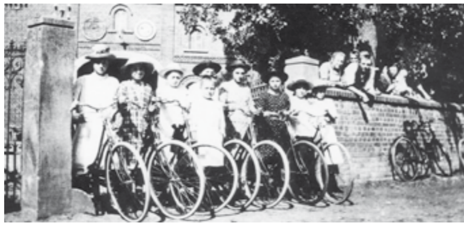
Die Damenabteilung des Radfahrvereins Stedorf

Annita Schröder hat rund um das Radfahren einige hiesige Zeitungsartikel, die zum Teil über 150 Jahre alt sind, zusammengestellt. In dem hier abgedruckten 6. Teil geht es um Gesundheitstipps für Radreisende. Hoyaer Wochenblatt vom 22.07.1904