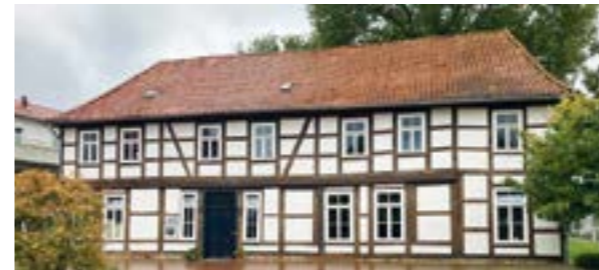
Das Foto links zeigt das ehrwürdige Gebäude 2023 und gehört zu den Baudenkmalern Rethems. Heute befindet sich darin eine Außenstelle der Sozialstation Aller-Leine-Tal.

Das auf dem obigen Foto im Hintergrund zu sehende Haus ist heute vermutlich das älteste Gebäude Rethems. Das ehemalige Amtsschreiberhaus, auch „Zweites Amtshaus“ genannt, wurde um 1685 erbaut. Das Gebäude ging 1879 in das Eigentum der Familie Wolters über. Heinrich Wolters war Zimmermeister und betrieb hier eine Zimmerei verbunden mit einem Sägewerk.