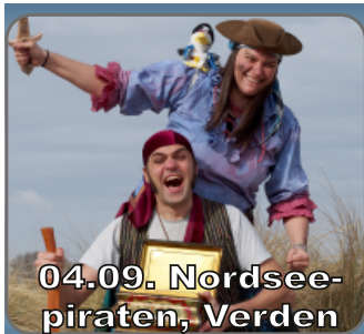
04.09. Nordsee- piraten, Verden