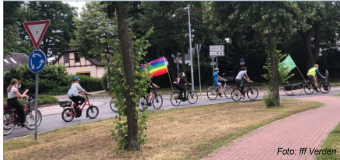
Am 9. Juli machen sich zahlreiche überwiegend junge Leute auf, um in der Verdener Innenstadt für eine andere Verkehrspolitik zu protestieren.

„Ich sag ‚Danni‘ – ihr sagt ‚bleibt!‘“, mein vierjähriger Mitbewohner springt durch die WG-Küche in Dörverden und lässt sein Abenteuer im Dannenröder Wald wieder aufleben. Dann holt er tief Luft, brüllt „Danni!“ und wartet darauf, dass ihm alle Erwachsenen im Raum lauthals „bleibt!“ entgegen. Ich teile seine Begeisterung. An der Wand hängt ein Poster mit 15 Fotos der schönsten Baumhäuser im Dannenröder Forst. Sie sind nicht mehr. Aber die Begegnung mit den Häusern