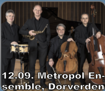
12.09. Metropol Ensemble, Dörverden