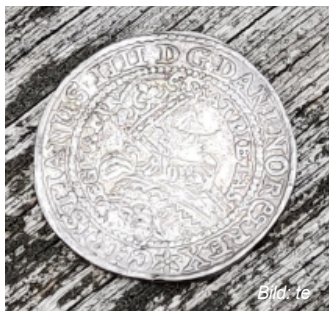
Auf dem Speciedaler ist das Abbild von Christian IV. zu sehen.

Fast 400 Jahre alte Münze in Dörverden gefunden