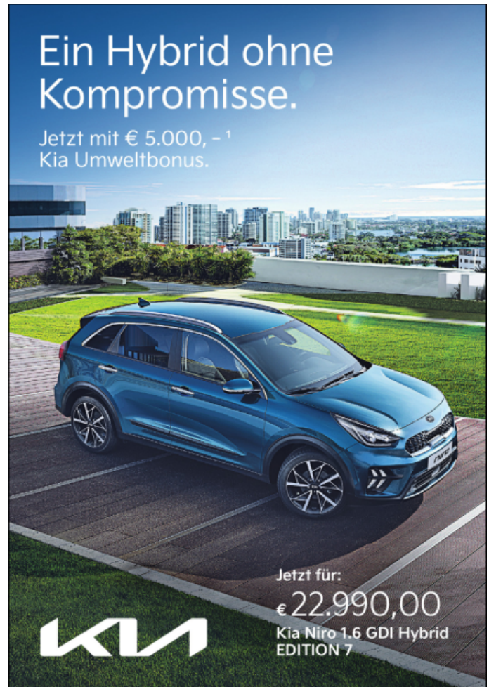
Abbildung zeigt kostenpflichtige Sonderausstattung.

Private Kleinanzeigen sind kostenlos. Kommerzielle Kleinanzeigen kosten 1,- € pro Zeile (Mindestbestellwert 10,- €). Einfach den Text aufschreiben und senden an oeverblick@verden-info.de oder Överblick, Eißeler Finkenbug 1, 27321 Thedinghausen.