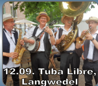
12.09. Tuba Libre, Langwedel