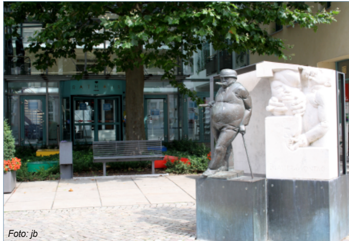
Am 12. September wird in Achim darüber abgestimmt, wer zukünftig Chef im Rathaus ist.