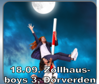
18.09. Zollhausboys 3, Dörverden