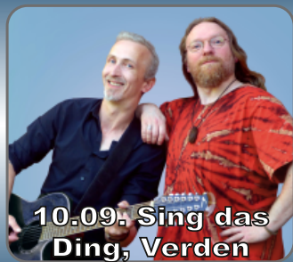
10.09. Sing das Ding, Verden